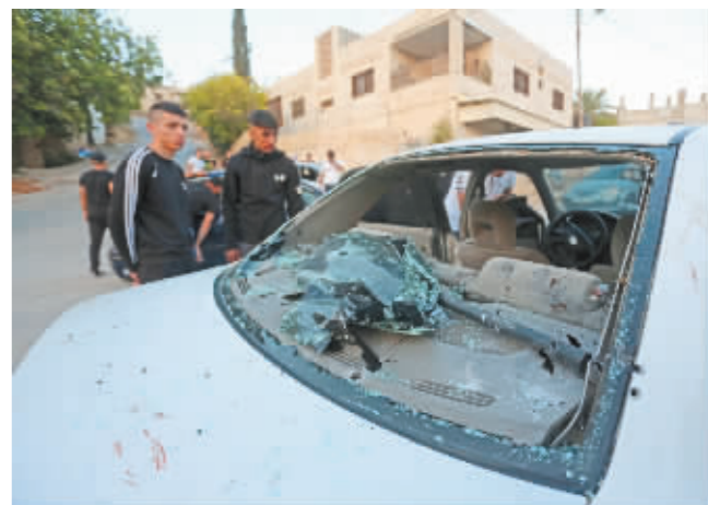
6月17日,在约旦河西岸北部城市杰宁,人们查看被打死的巴勒斯坦人乘坐的车辆。

新华社拉姆安拉6月17日电 巴勒斯坦卫生部17日说,以色列军队当天凌晨在约旦河西岸北部城市杰宁打死3名巴勒斯坦人。当地巴勒斯坦人随后与以军发生冲突,造成8名巴勒斯坦人受伤。