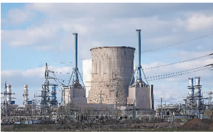
这是3月18日在德国林根拍摄的天然气发电站。

新华社北京6月17日电 俄罗斯天然气工业股份公司(俄气)近来接连减少“北溪-1”天然气管道对欧洲的供气量,称原因是合作伙伴德国西门子未能按时送回修理的气体压缩机部件,影响管道运行。