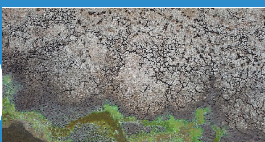
连续13年干旱后,位于智利中部的佩祖埃拉斯湖几乎干涸。这一湖泊如今所剩水量仅相当于两个游泳池。