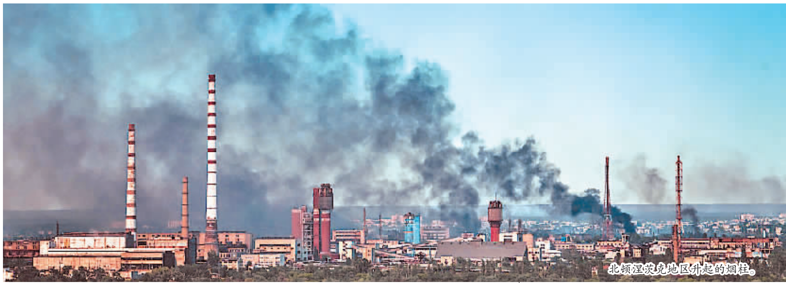
北顿涅茨克地区外起的烟柱。

目前,俄乌冲突仍在持续。一方面,乌克兰方面抱怨美欧动作太慢,承诺提供给乌方的反导系统迟迟不到位。另一方面,有美国官员表示,会很快为乌克兰提供更多武器。