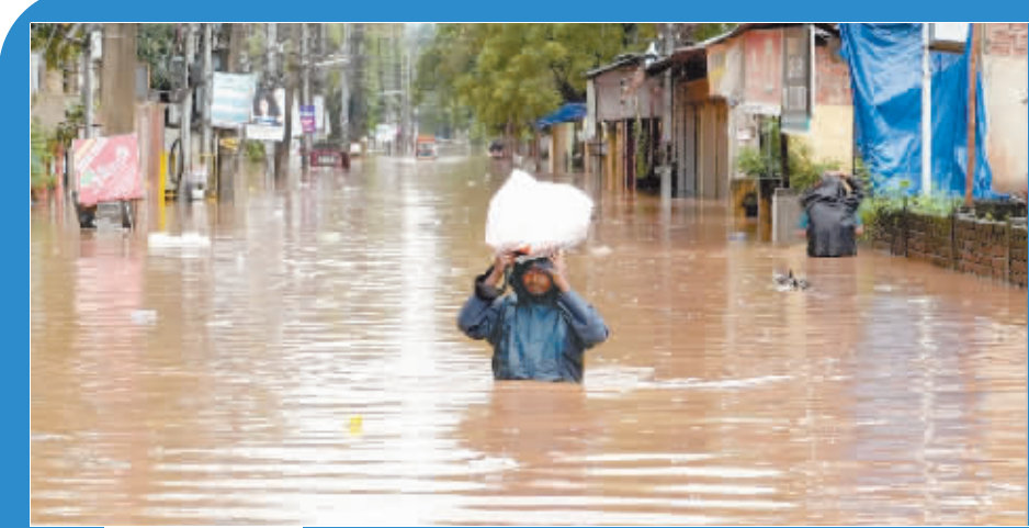
6月14日,在印度高哈蒂,一名男子在洪水中前行。印度近日迎来季风雨季,多地暴雨成灾。