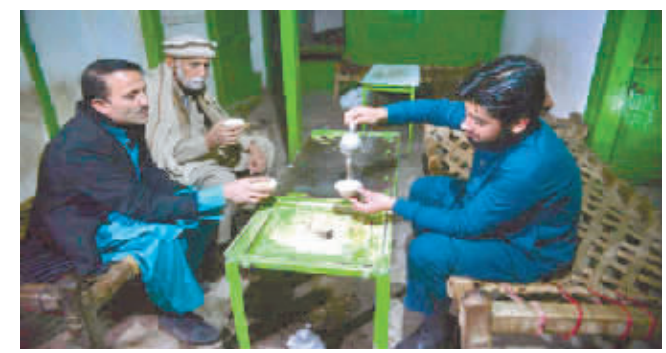
人们在巴基斯坦一茶馆里饮茶。

据新华社电 巴基斯坦计划发展部长阿赫桑·伊克巴尔14日呼吁国民每天少喝一点茶,以减少茶叶进口,缓解外汇短缺之急。伊克巴尔当天在首都伊斯兰堡对媒体说,国家举债进口茶叶,因此恳请民众每天少喝一两杯茶。