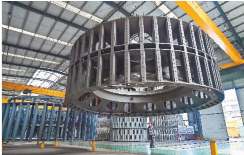
6月15日,山东省一家风电设备生产企业车间内正在进行吊装作业。

恢复基础还需要巩固。”国家统计局新闻发言人、国民经济综合统计司司长付凌晖说,下一阶段,要高效统筹疫情防控和经济社会发展,加大宏观政策调节力度,推动稳增长一揽子政策措施落地见效,着力稳定宏观经济大盘,着力保障和改善民生,推动经济持续恢复。