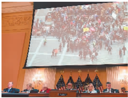
6月13日,美国国会众议院特别委员会就国会山暴乱调查举行第二场系列公开听证会。

为深入调查“国会山暴乱”事件,美国国会众议院“国会山暴乱”事件特别委员会自9日起召开系列听证会。当地时间13日,被传唤作证的是特朗普的竞选经理比尔·斯特皮恩。