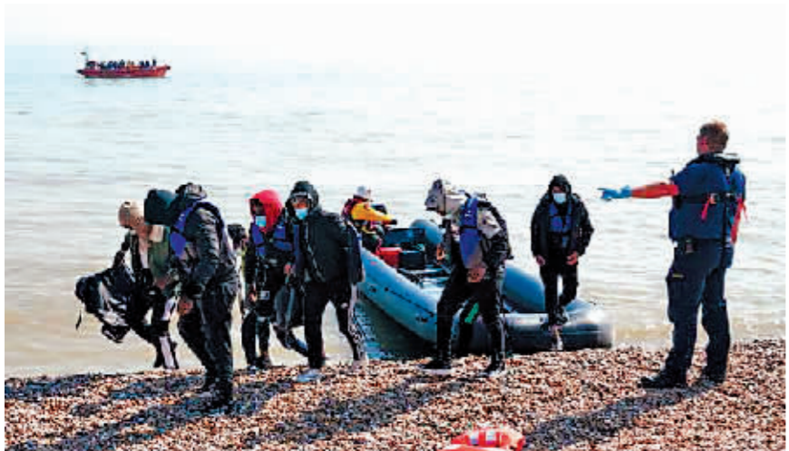
偷渡客乘充气船穿过英吉利海峡。

不顾各方批评,英国政府定于14日开始执行“偷渡者遣送卢旺达”政策。第一架包机当晚从伦敦起飞,把部分经英吉利海峡偷渡至英国的移民运送至这个万里之外的非洲国家,由卢方处理其难民身份申请。