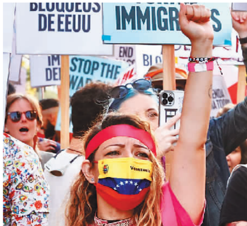
民众在美国加利福尼亚州洛杉矶举行游行,抗议美国的外交政策。