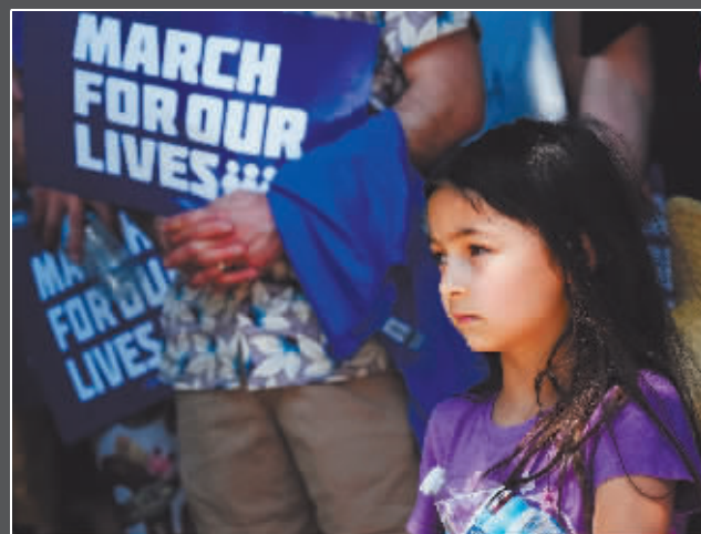
▶一名女孩在美国洛杉矶参加控枪集会。