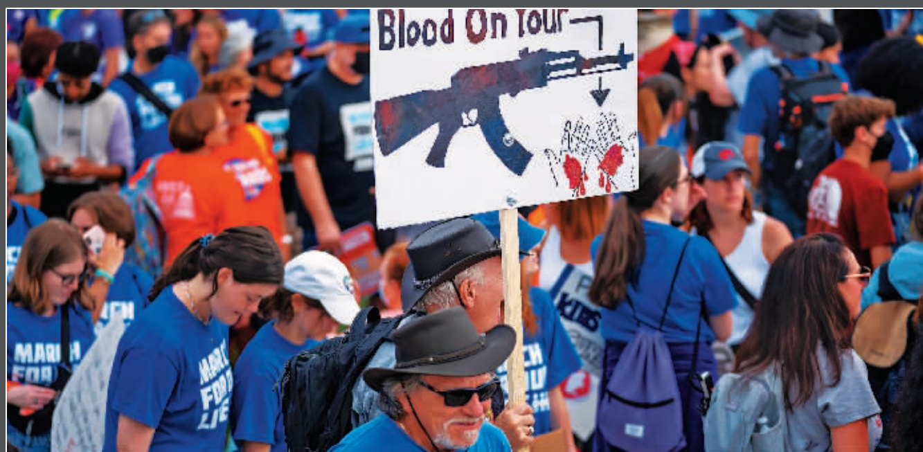
人们在美国华盛顿参加控枪集会。