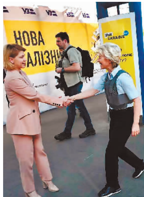
▲11日,欧盟委员会主席冯德莱恩(右)抵达乌克兰。

乌克兰于2017年正式成为欧盟联系国。今年2月俄乌冲突爆发后,泽连斯基于2月28日签署乌克兰申请加入欧盟的文件,呼吁欧盟启动“新的特殊程序”迅速吸纳乌克兰。