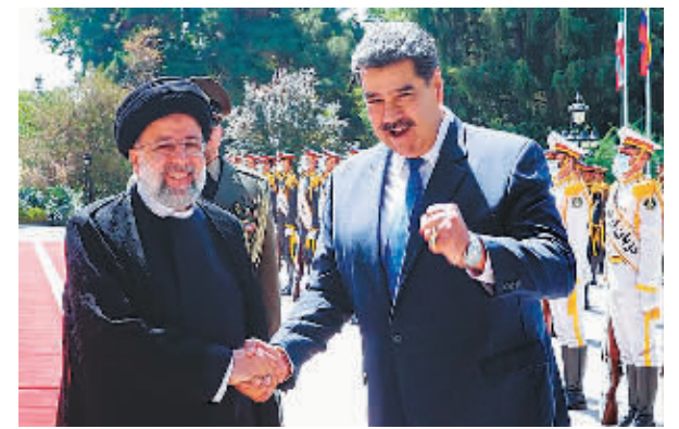
委内瑞拉总统马杜罗(右)与伊朗总统莱希。

据新华社电 伊朗和委内瑞拉11日签订20年合作协议,涉及能源、石化、国防和文化等领域。