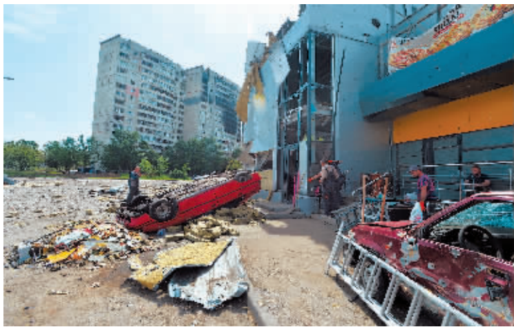
▲在乌克兰哈尔科夫市东北部北萨尔托夫卡拍摄的受损建筑和车辆。