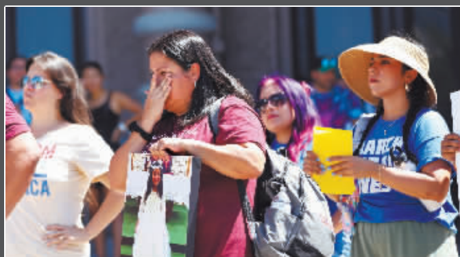
▲人们在美国得克萨斯州奥斯汀参加控枪集会。

美国网站“枪支暴力档案”最新数据显示,今年以来,美国已经发生256起造成至少4人死伤的枪击事件,超过1.9万人因枪支暴力失去生命,包括735名未成年人,其中158人不到12岁。