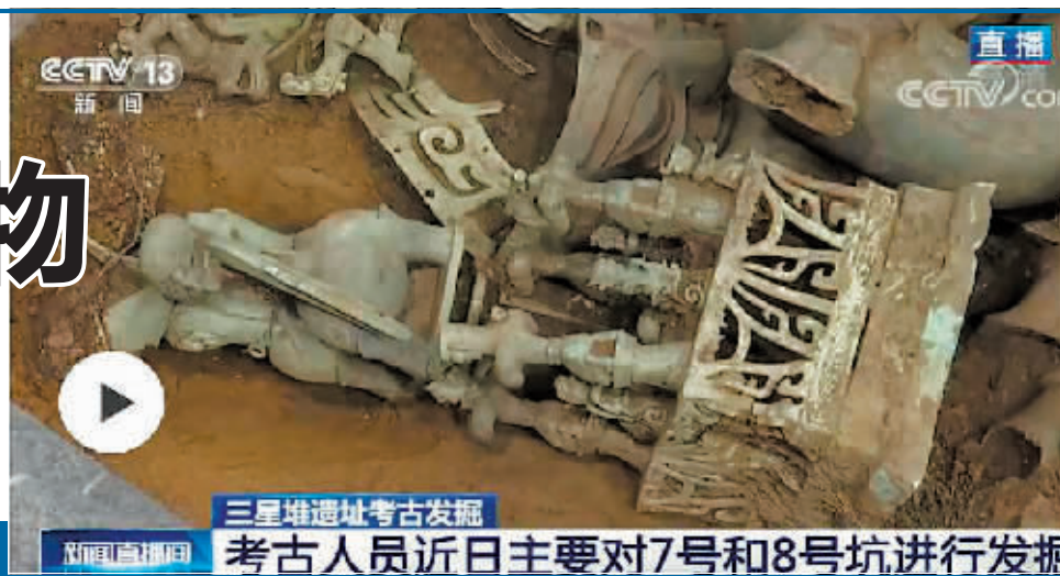
三星堆本轮考古发掘出土大量青铜器、金器、玉器等文物。

三星堆本轮大规模考古发掘工作开展以来,大量珍贵的青铜器、金器、玉器等文物相继出土,考古工作者正在一步步揭开三星堆神秘的面纱。目前考古工作进行到哪一步了?又有哪些新出土的文物呢?近日考古人员主要对7号和8号两个祭祀坑进行发掘,从11日开始重点工