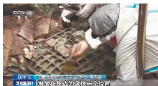
出土大量“小而美”文物是7号坑的特点。

截至目前,考古发掘显示,三星堆7号坑出土文物仍保持着“小而美”的特点,满坑小件器物堆积,显得“琳琅满目”。现在考古专家预计,7号坑可提取文物上万件。