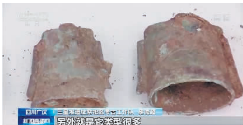
7号坑提取的器物中发现的铜铃。

7号坑还发现了许多形态基本一致的青铜挂架,顶部有圆纽,中部呈辐条状,底部则为圆圈承接。挂架的大小同样差异较大。3月31日,7号坑提取出土的这件“带挂架铜铃”,则直观地展示出,铜铃、挂架组合在一起的部分样貌。