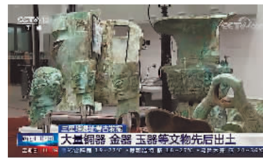
2号、3号、8号坑出土了大量大型青铜器。

截至目前,三星堆遗址祭祀区新发现的3号、4号坑已经发掘完毕;5号、6号坑已整体提取,正在进行实验室考古。7号和8号坑仍在进行田野发掘。”