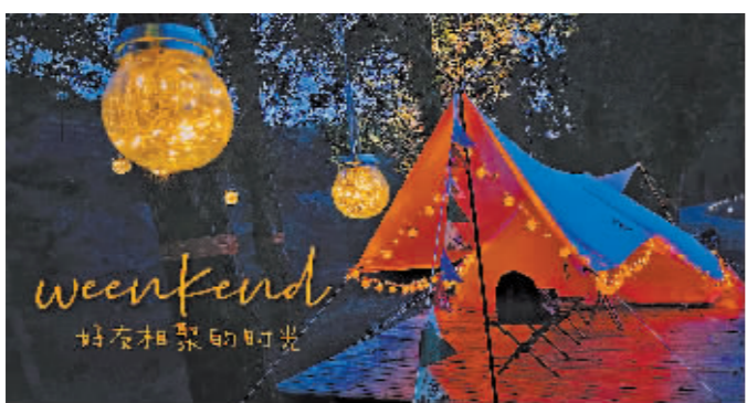
哈尔滨露营创业者在全国的露营地。

围绕着露营热潮,一条完整的产业链也渐成规模,露营装备生产厂家、露营地经营者以及周边产品都跟着火爆起来。有数据显示,2014年至2021年,中