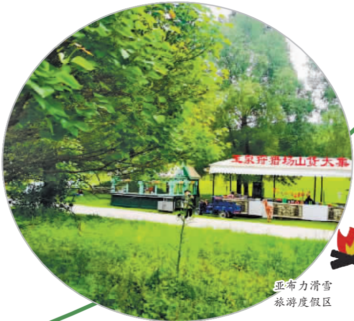
亚布力滑雪旅游度假区