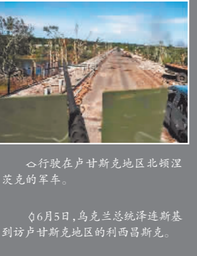
行驶在卢甘斯克地区北顿涅茨克的军车。6月5日,乌克兰总统泽连斯基到访卢甘斯克地区的利西昌斯克。