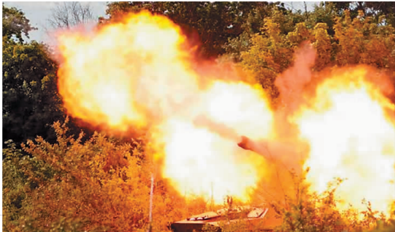
开火中的2S1式自行榴弹炮。

最近,围绕乌克兰东部城市北顿涅茨克的争夺战持续进行。自5月下旬以来,俄军对北顿涅茨克市的炮击频率大幅增加,双方围绕这座城市一度展开巷战,胶着状态持续10日有余。6月7日,俄国防部长绍伊古表示,俄军已完全控制北顿涅茨克居民区,目前正在继续争夺其工业区和附近居民点控制权。不久前在马里乌波尔的冲突伴随着亚速钢铁厂守军走出据点进入尾声。此刻,新的“风暴眼”又在北顿涅茨克生成。乌克兰国防部发言人莫图兹亚尼克称,如今乌克兰东部地区的局势极为困难,乌东战事的结局或将决定乌克兰一国的命运。