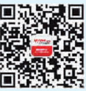
哈尔滨新闻网微信