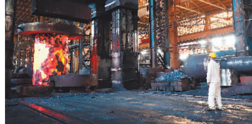
在中国一重集团有限公司,工人在车间内忙碌(5月19日报)。

由中车齐车集团齐车公司自主研发的200多辆罐车和罐车,今年4月首次批量出口智利,公司海外市场版图再次扩增。