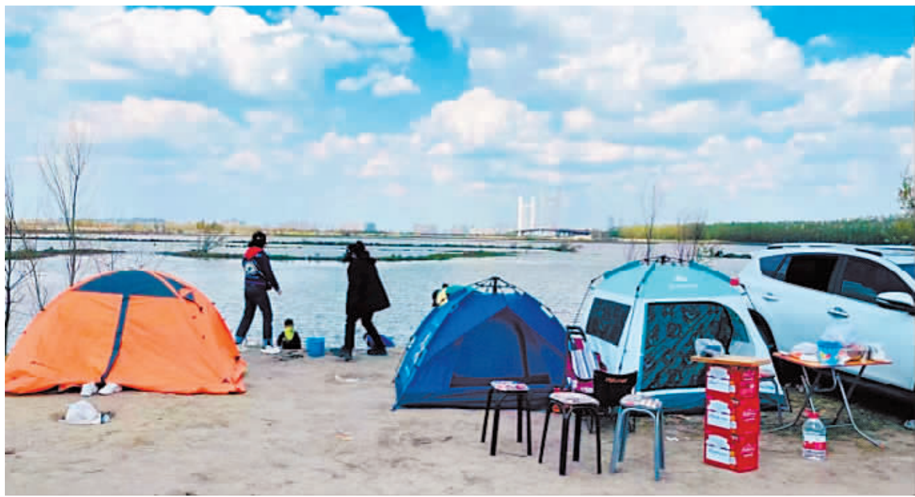
市民在湿地露营。

据马蜂窝发布的《2022 露营品质研究报告》数据显示,81%的游客选择1-3天的短期露营,将亲近自然、恢复元气的美好期望寄托在了“一夜乌托邦”里。一部分资深露营党喜欢花大价钱提升装备,而更多的消费者偏向千元以内的平价露营装备,虽然两者预算不同,但玩得尽兴才是终极目标。