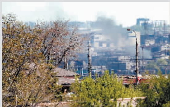
5月8日,浓烟从马里乌波尔市亚速钢铁厂升起。

乌克兰马里乌波尔市市长顾问安德留留科13日通报,俄军正试图在炮火的掩护下攻入亚速钢铁厂,乌克兰守军正在顽强抵抗,形势日益严峻。