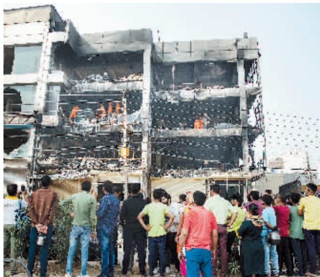
5月14日,人们聚集在印度新德里发生火灾的建筑周围。

新华社新德里5月14日电 据印度警方消息,首都新德里13日发生的火灾造成的死亡人数已上升到27人,另有数十人受伤。