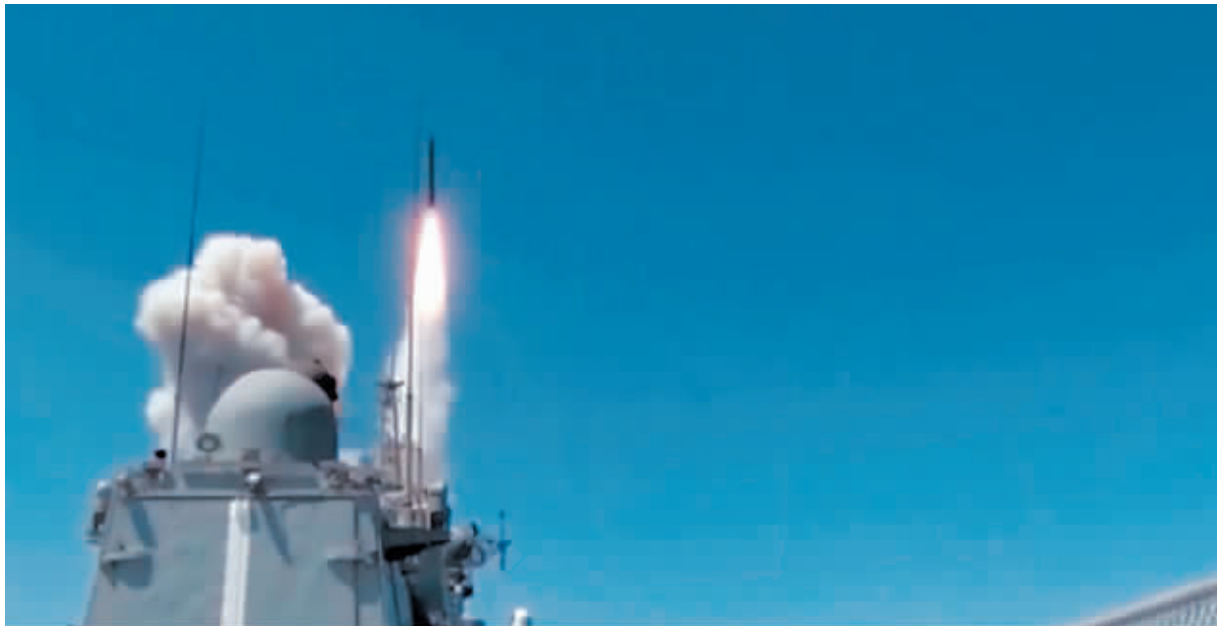
图为俄罗斯国防部发布的视频打击画面。

俄副外长格鲁什科14日表示,如果芬兰加入北约,俄罗斯不会作出情绪化的决定,而是将审慎地采取行动。他表示,俄罗斯对芬兰和瑞典没有敌意,现在谈论俄罗斯在波罗的海地区部署核武器为时尚早,但这两个国家加入北约只会导致北部地区军事化。格鲁什科表示,如果北约将核力量和基础设施部署到俄罗斯边境,俄罗斯将采取充分的防范措施来应对。