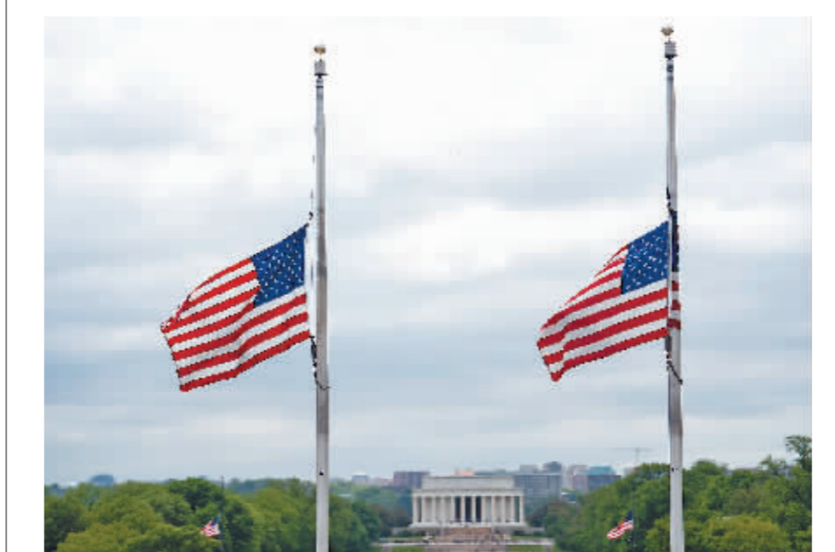
美国总统约瑟夫·拜登12日下令白宫和所有联邦公共建筑物降半旗,以哀悼因感染新冠病毒死亡的百万民众。