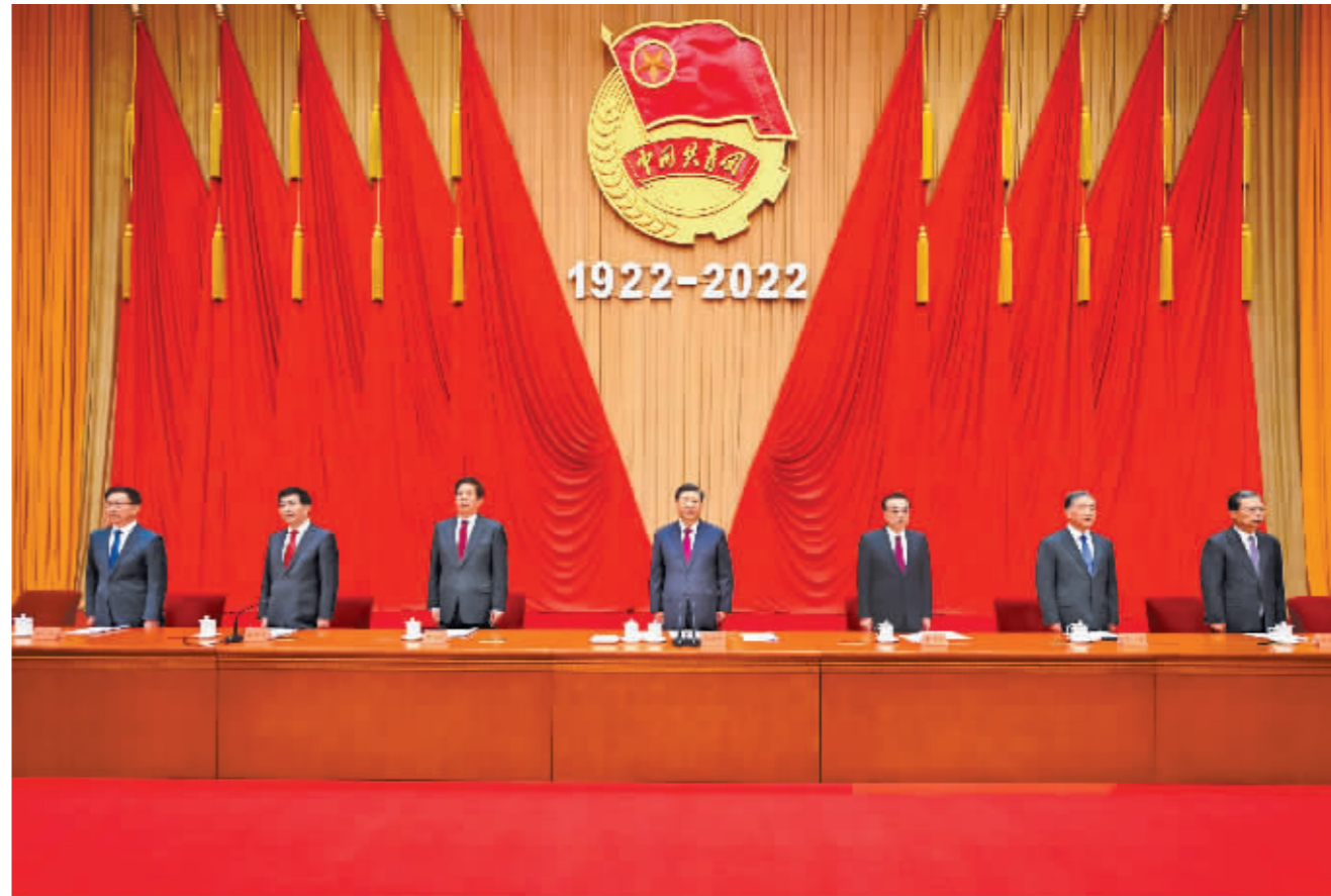
5月10日,庆祝中国共产主义青年团成立100周年大会在北京人民大会堂隆重举行。习近平、李克强、栗战书、汪洋、王沪宁、赵乐际、韩正等出席大会。

新华社北京5月10日电 庆祝中国共产主义青年团成立100周年大会10日上午在北京人民大会堂隆重举行。中共中央总书记、国家主席、中央军委主席习近平在会上发表重要讲话强调,青春孕育无限希望,青年创造美好明天。新时期的中国青年,生逢其时、重任在肩,施展才干的舞台无比广阔,实现梦想的前景无比光明。实现中国梦是一场历史接力赛,当代青年要在实现民族复兴的赛道上奋勇争先。共青团要牢牢把握培养社会主义建设者和接班人的根本任务,坚持为党育人、自觉担当尽责、心系广大青年、勇于自我革命,团结带领广大团员青年成长为有理想、敢担当、能吃苦、肯奋斗的新时代好青年,用青春的能动力和创造力激荡起民族复兴的澎湃春潮,用青春的智慧和汗水打拼出一个更加美好的中国。 中共中央政治局常委李克强、栗战书、汪洋、王沪宁、赵乐际、韩正出席大会。人民大会堂二层宴会厅气氛隆重热烈。主席台上悬挂着“庆祝中国共产主