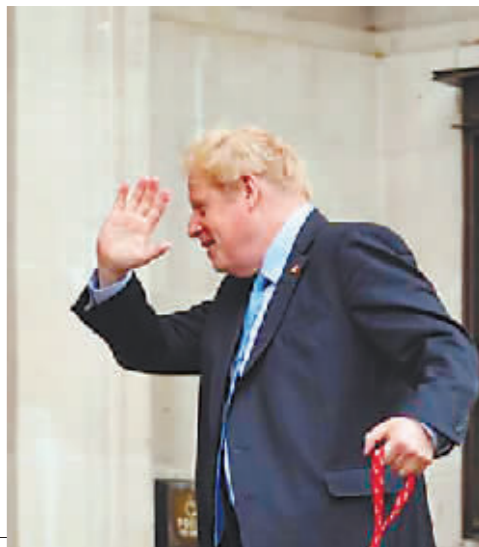
英国首相约翰逊抵达投票站准备投票。