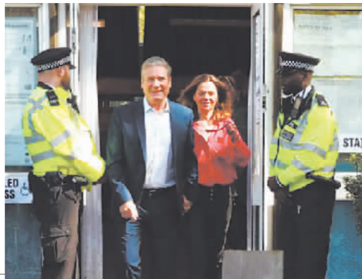
英国工党领袖斯塔默与妻子在伦敦一家投票站投票后准备离开。

不过,分析人士认为,保守党所受损失不及预期惨重,主要反对党工党选情虽有突破,但仍不足以改变英国政坛大局。