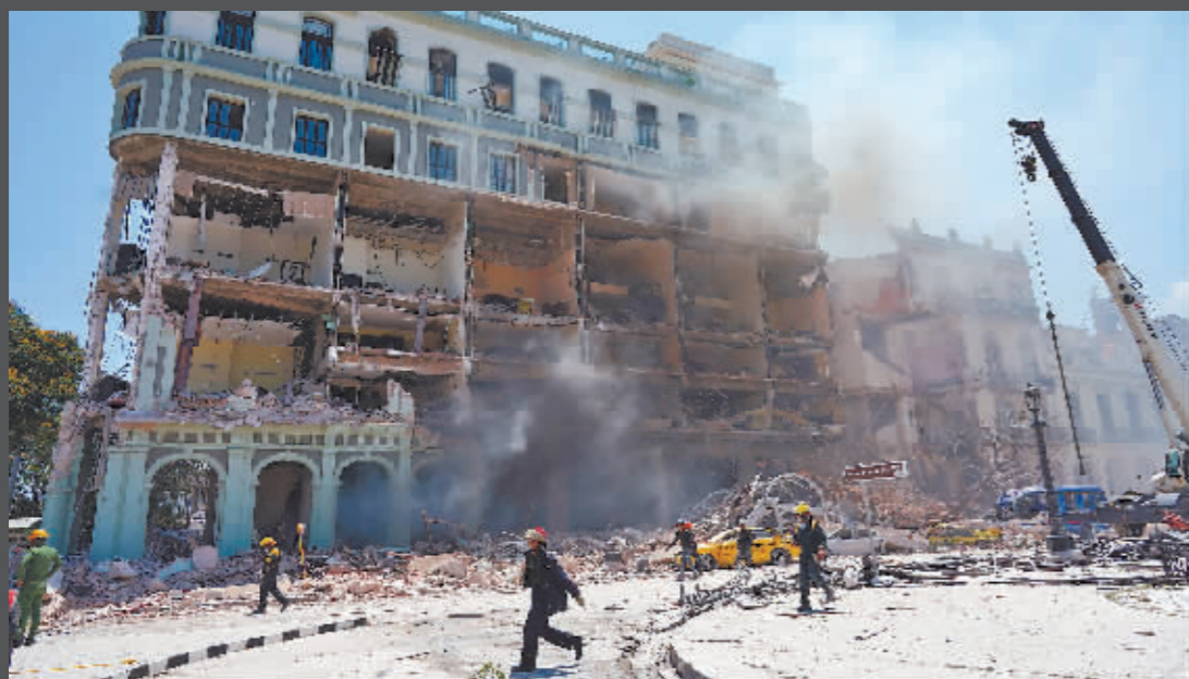
5月6日,救援人员在古巴首都哈瓦那的萨拉托加酒店爆炸事故现场工作。