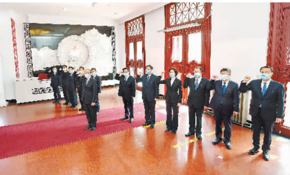
5月3日上午,许勤带领新一届省委常委班子到东北烈士纪念馆缅怀革命先烈重温入党誓词。