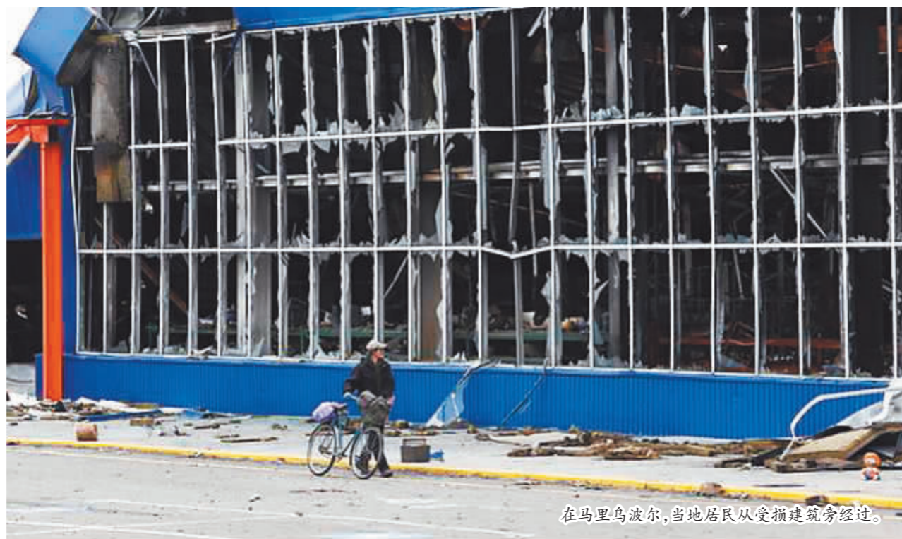
在马里乌波尔,当地居民从受损建筑旁经过。

乌克兰副总理韦列修克4月30日表示,乌俄当天再次交换被扣押人员。7名乌军士兵和7名平民被俄军释放。韦列修克说,俄方目前仍扣押约1000名乌克兰人。