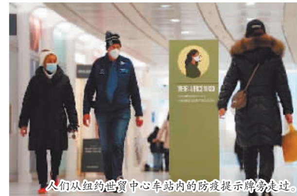
人们从纽约世贸中心车站内的防疫提示牌旁走过。

据新华社电 美国媒体报道,美国绝大多数州最近两周新增新冠确诊病例和住院病例数均明显增加,意味着新冠病毒变异株奥密克戎引发的新一轮疫情正扩大至全美范围。据美国《纽约时报》4月30日报道,4月初,美国新增新冠确诊病例数趋稳,新冠住院病例数降至疫情暴发以来最低水平。然而,4月中旬以来,除3个州外,美国绝大多数州新增确诊病例数均呈现增加趋势,全美范围内新冠住院病例数也在上升。