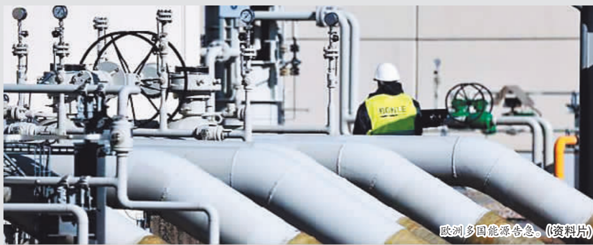
欧洲多国能源告急。(资料片)

但张弘同时指出,俄罗斯在未来很长一段时间,会面临比较困难的经济环境和安全环境,国际体系及国际格局也会因此发生变化。