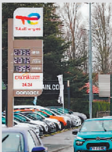
车辆经过法国西南部城市圣让-德吕兹的一处加油站。

而放眼未来,张弘表示,由于能源安全的重要性,多数国家还是会选择接受“卢布结算令”,“保证欧洲的安全,保证欧洲的经济稳定,保证就业,这对于欧洲国家来说是有益的”。