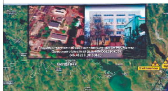
俄方展示的美在乌境内开展生物军事项目的相关信息。

■泽连斯基4月30日与英国首相约翰逊通电话。双方讨论了乌前线的局势,特别是马里乌波尔的局势,以及对乌克兰的援助问题。