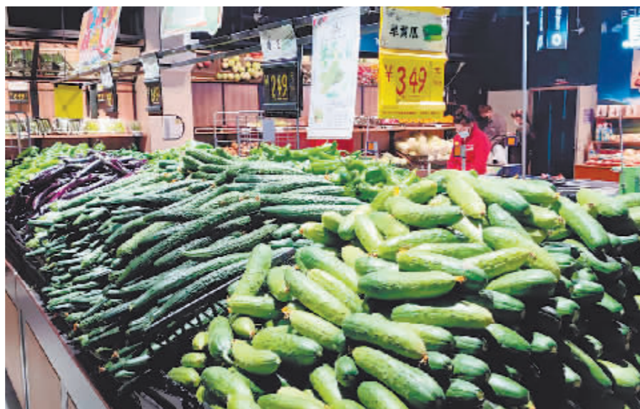
超市内蔬菜等民生商品供应充足。

本报讯(记者 李佳琪 文/摄)4月21日,记者采访哈市多家超市了解到,无论是线上还是线下,各大超市采取多种措施保供稳价。