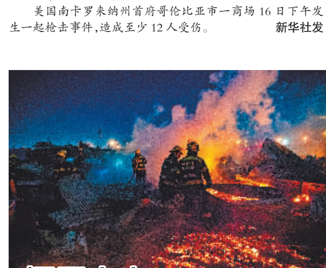
棚屋失火 当地时间4月16日晚,位于南非开普敦加小镇发生火灾,100多间棚屋被毁,数百人无家可归。