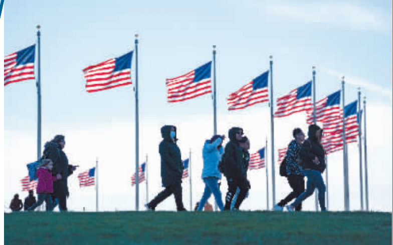
行人走在美国首都华盛顿的国家广场。