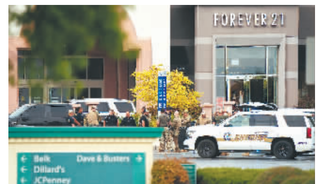
商场枪击 4月16日,执法人员在美国南卡罗来纳州哥伦比亚市发生枪击事件的商场外集结。