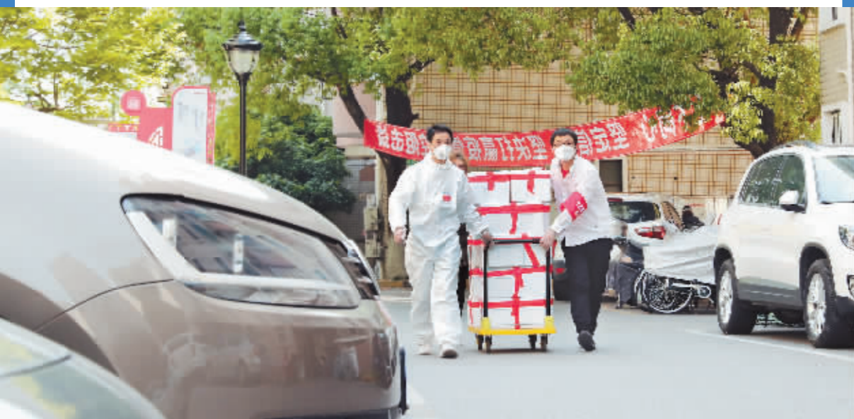
4月11日,上海市闵行区的志愿者们为居民派送生活物资。

疫情防控形势严峻,上海实行全域静态管理以来,基础设施和公共服务在全力运转,以保障城市的平稳运行,助力疫情防控大局。