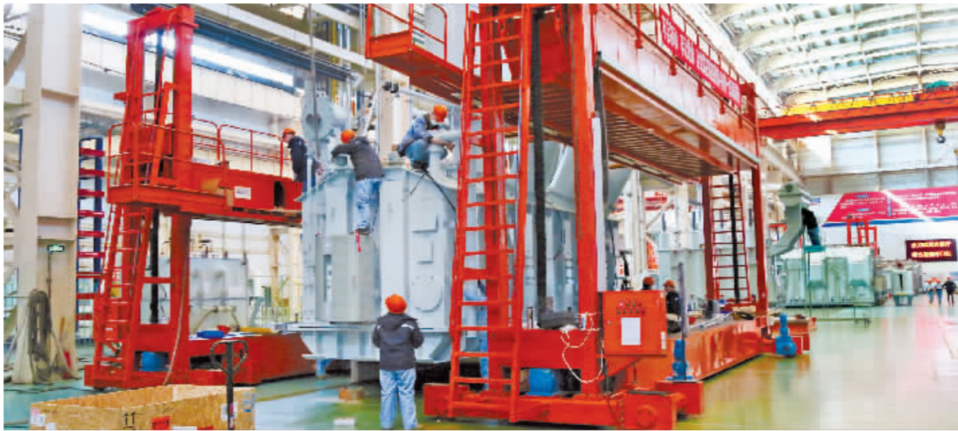
哈电碳公司车间内工人有序生产。

今年以来,订单饱满的哈电碳公司坚决筑牢防疫屏障,创新科技引领,聚力在新产品研发上下功夫,一季度投入研发经费300万元,同比增长82%,其中国家核电重点项目“国和一号”石墨配套产品的开发,不仅能够满足重点项目的应用,还可以应用于航空、水下工程等关键设备中,实现碳石墨材料的国产化替代,技术