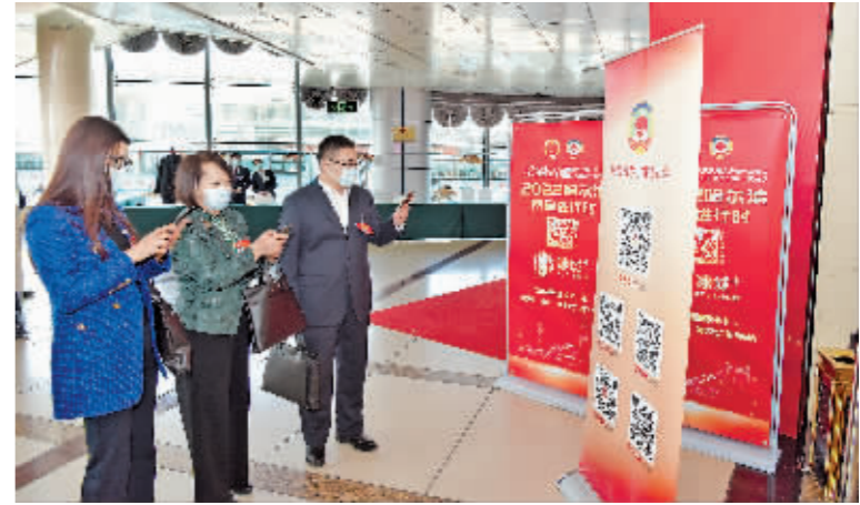
政协委员扫码关注市政协全媒体宣传矩阵。

本报讯(记者 李威)12日,市政协全媒体宣传矩阵宣传展页在哈尔滨国际会议中心一亮相,便引起广大委员的关注和兴趣,委员们争相拿出手机扫码关注市政协宣传媒体,与大会进行实时互动,及时收看会议进程新闻。会议期间,市政协官方微博对开幕式全程“微直播”,现场图文实时推送,市政协官方微信、网站、政协论坛等媒体同步对大会进程、选举动态、委员建言等进行全方位报道。