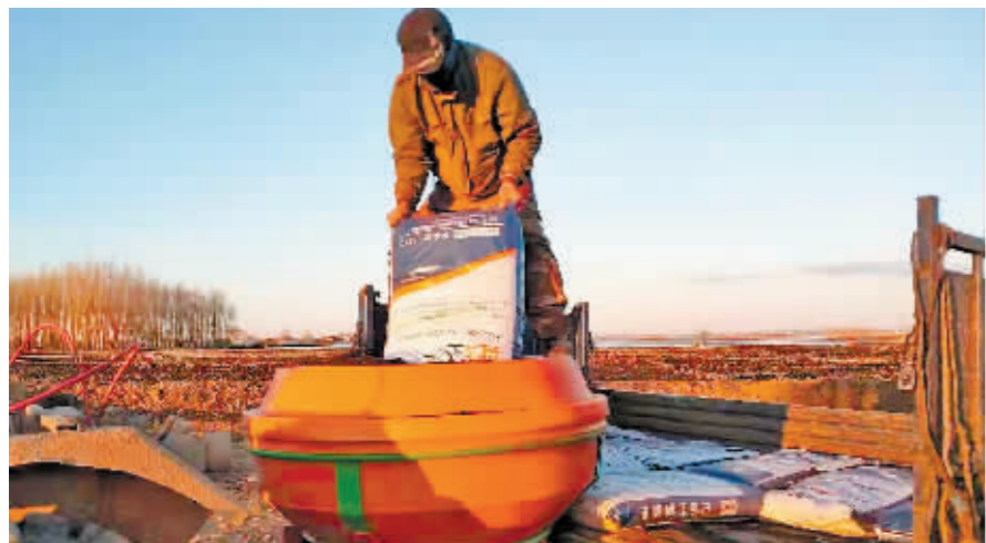
农民分散劳作不聚集。

本报讯(曹华君 记者 罗彦坤)近日,在严格落实疫情防控措施的同时,木兰县科学统筹、有序开展农业生产,全县8个乡镇的水田区相继育苗作业,预计本月中旬完成水稻育苗,5月中旬开始插秧。