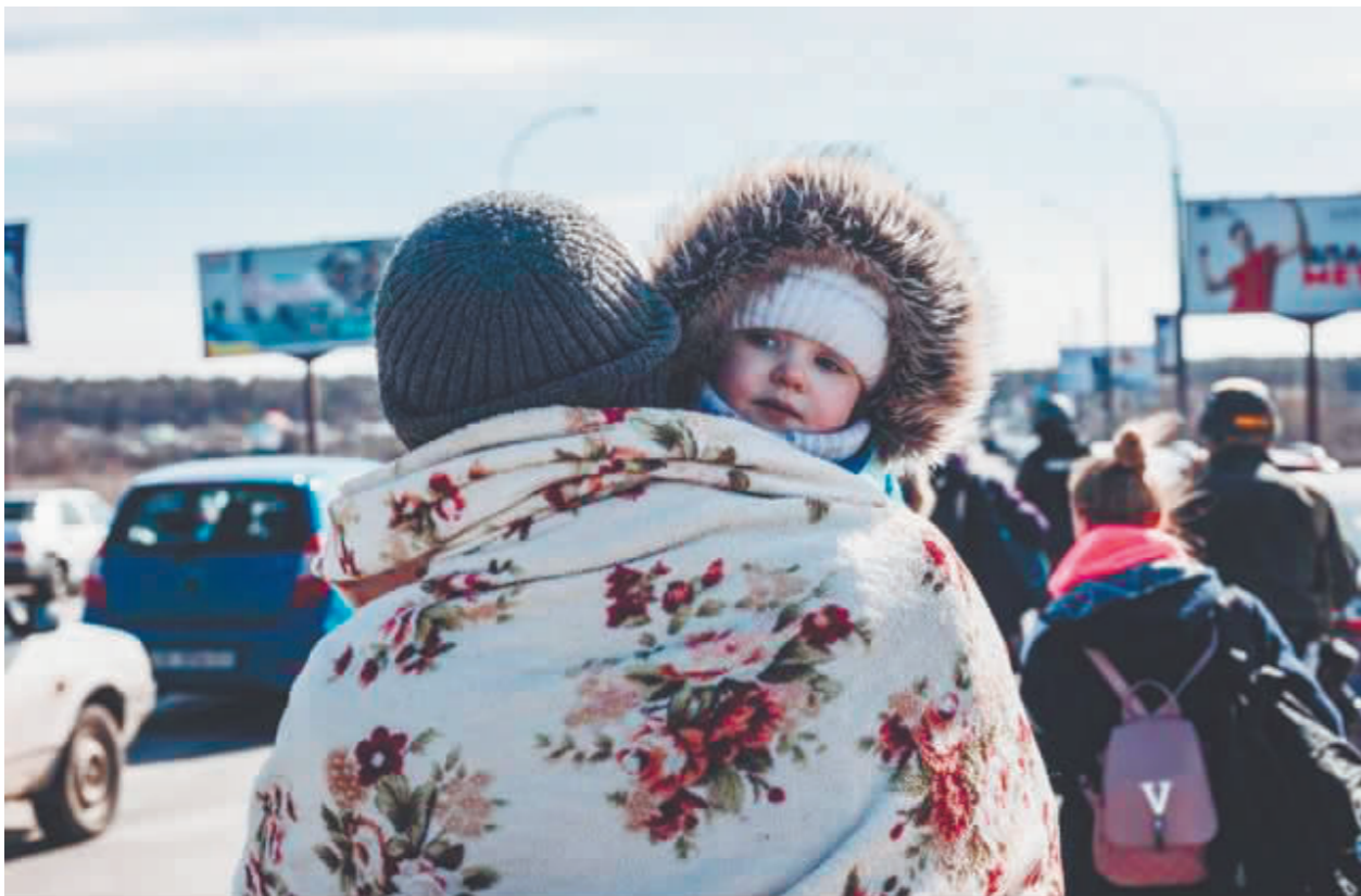
人们在乌克兰基辅州伊尔平通过人道主义通道撤离。

德国政府官员3日说,西方国家或将同意在今后几天对俄罗斯施加更多制裁,理由是乌克兰方面当天发布视频,指认俄军在乌首都基辅附近杀害平民。俄罗斯方面当天谴责有关视频造假,目的是干扰俄乌和平谈判。