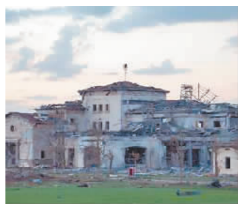
3月13日,在伊拉克库尔德自治区首府埃尔比勒,美国驻埃尔比勒领馆附近的建筑在导弹袭击中受损。

伊朗外交关系战略委员会主席、伊朗前外长哈拉齐日前在卡塔尔参加第20届多哈论坛时说,伊核谈判接近达成协议,伊朗已对此做好准备,但还要看美国意愿以及伊朗所提条件是否得到满足,重要的是美国必须将伊朗伊斯兰革命卫队从恐怖组织名单中移除。2018年5月,美国单方面退出伊核协议,随后重启并新增一系列对伊制裁措施。2019年4月,美国把伊朗伊斯兰革命卫队列为“恐怖组织”,这是美国政府首次将一国的国家武装力量列为恐怖组织。被问及美方是否会撤销把伊朗伊斯兰革命卫队列为恐怖组织的决定时,美国伊朗问题特使