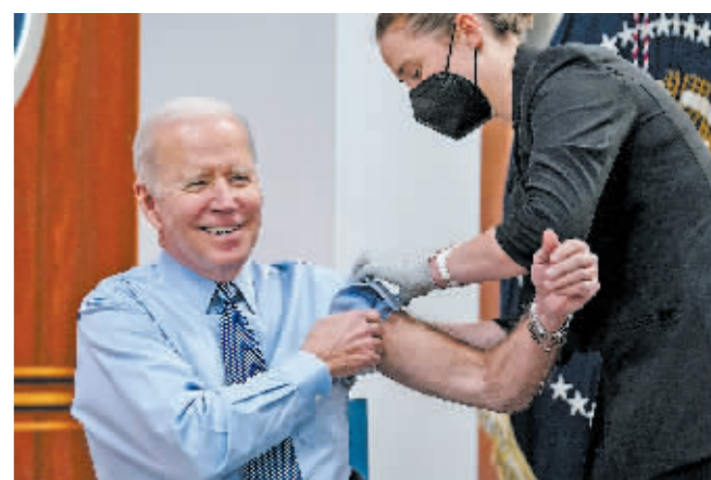
3月30日,美国总统拜登在华盛顿白宫接种新冠疫苗第四针。