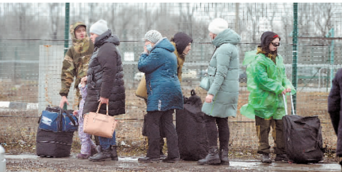
2月24日,来自顿巴斯地区的难民通过一处边境检查站进入俄罗斯罗斯托夫州。

德国副总理兼经济和气候保护部长哈贝克30日宣布,德国进入天然气应急方案预警阶段。他说,目前德国的天然气供应安全仍可得到保证,启动应急方案是为了防止局势进一步恶化。德国已召集危机应对小组对当前的天然气供应情况进行评估,并将采取进一步措施以确保天然气供应。德国天然气应急方案分为预警、警戒和紧急三个阶段。俄罗斯总统普京日前宣布,俄方向欧盟成员国等“不友好”国家和地区供应天然气时将改用卢布结算。