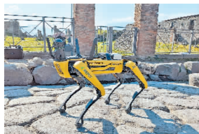
一条名叫“点点”的机器狗日前现身意大利庞贝古城,协助管理机构开展对古城的研究和保护工作。“点点”配备摄像头和传感器,能在古城各处探查并采集数据,为开展保护工程提供数据参考。图为3月22日,机器狗“点点”在意大利庞贝古城工作。