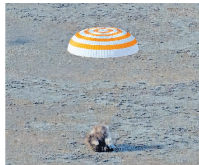
3月30日,美国宇航员范德·海与俄罗斯宇航员彼得·杜布罗夫和安东·什卡普列罗夫乘坐的“联盟”飞船着陆。

据新华社电 美国宇航员马克·范德·海与两名俄罗斯宇航员30日乘坐俄罗斯“联盟”飞船从国际空间站返回地球。范德·海在国际空间站连续停留355天,成为在国际空间站连续停留时间最长的美国宇航员。