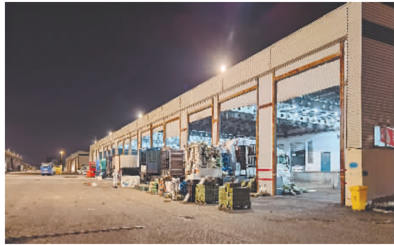
3月30日晚,在海吉星农产品市场,工作人员向货车上菜运菜。

针对群众提出的诉求,“道歉”后的长春市政府如何解决“买菜难”?记者对此深入追踪采访。