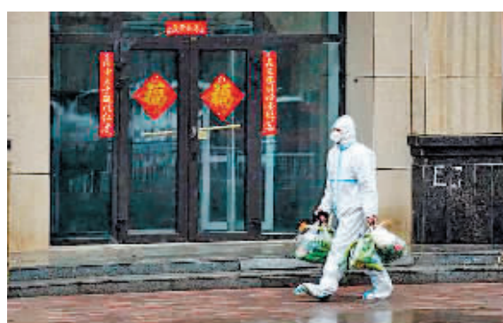
3月29日,在长春市一处管控小区内,工作人员在雨雪中为居民配送蔬菜包。

最后是“联动”。全省一盘棋进行资源统筹,组织省内其他没有疫情或疫情较轻的城市参与,帮助畅通货源。各地以蔬菜包形式供应,还缓解了长春分拣、配送人员不足的问题。