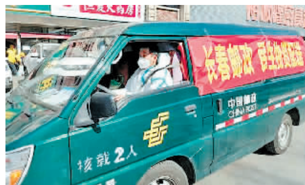
长春邮政民生物资配送车在进行生活物资配送。