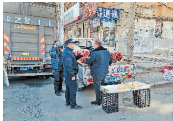
执法人员督促商贩自行撤离。

在维护城市秩序的同时,近日,哈市各城区执法队员按照相关部署第一时间组织下沉防疫一线,24小时昼夜值守防疫卡点,协助入户核酸、小区巡查、代送物资……志愿者们冲锋在前,恪尽职守,无私奉献,连续战斗在疫情防控第一线,用实际行动筑牢冰城防疫屏障。