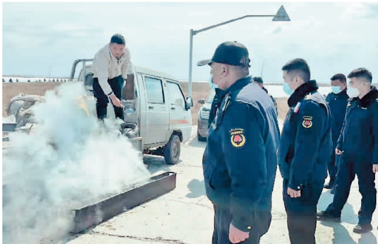
执法人员取缔露天烧烤。

平台招揽顾客,到自己非法经营的摊位消费,形成了所谓的“网红”露天烧烤;同时,个别路段占道经营现象也有所抬头……这些不仅影响城市环境秩序,更容易引起人员聚集,破坏全城的疫情防控努力成果。”市城管局相关负责人介绍,为了进一步强化防疫政策的落实、避免人员聚集,市城管局组织全市执法部门开展了露天烧烤和占道经营的专项治理行动,目前已经取得了显著成效。