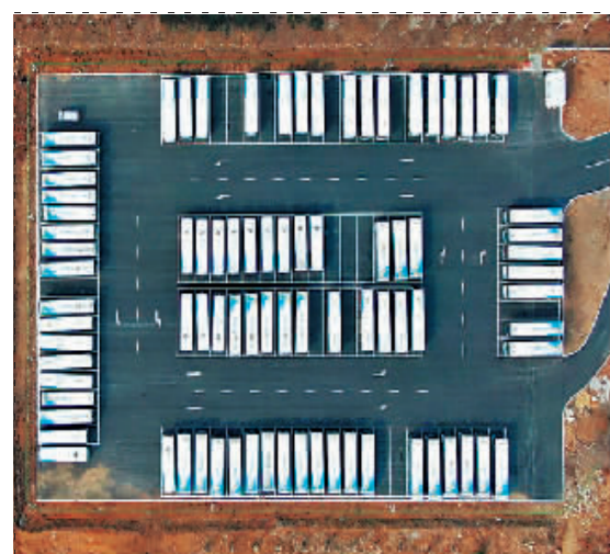
3月24日,沈阳公交系统暂停,这是在沈阳公交车停车场拍摄的公交车。

小区封闭、公交地铁停运、全市居家办公……24日的沈阳是没有早高峰的一天。从这一天起,沈阳按下为期7天的暂停键,连续开展三轮全员核酸检测。