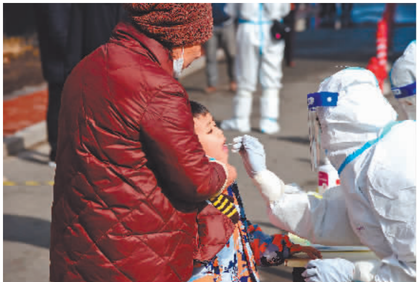
3月24日,在长春市一处核酸检测点,居民在接受核酸采样。

记者从吉林省卫健委了解到,23日0-24时,吉林省新增本土确诊病例和无症状感染者超过2500例。截至目前,吉林省本轮疫情累计报告本土确诊病例已超2万例,其中,长春市累计报告本土确诊病例已超1万例。