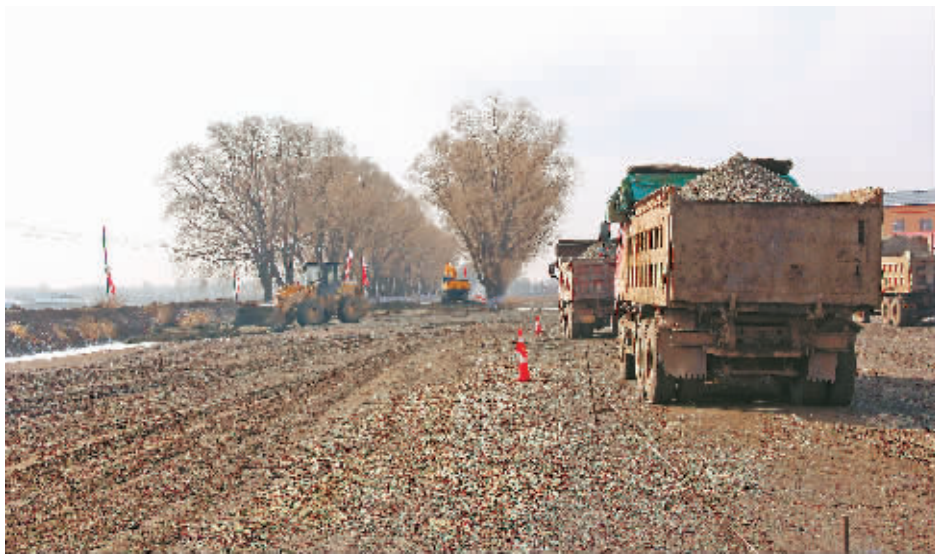
改扩建工程施工现场。

“都不用我比,卖场顾问会根据我的需要,帮我计算怎么搭配更划算,很贴心”,不少消费者感受到了明显的不同。事实上,不同于其他商场“单一品牌设置专属销售员”的模式,正阳家园导购员思维构建“全品类顾问式服务”,解决了销售员了解产品片面、专推某品牌高利润产品等一系列问题。正阳家园位于平房区南海路2号,记者看到,这里除了有集家具、家电和新能源汽车等于一体的3600平方米卖场,还有一个过