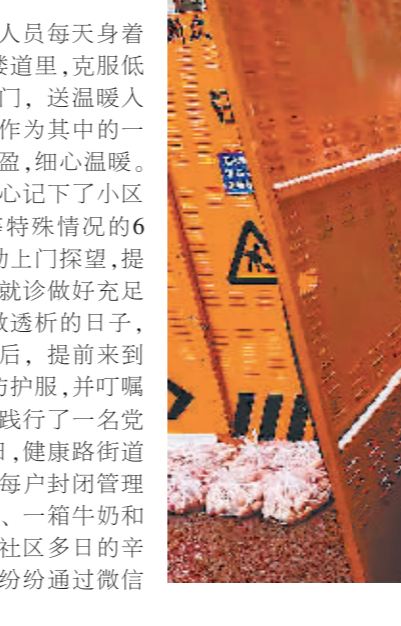
“大白”们为居民送去生活必需品。