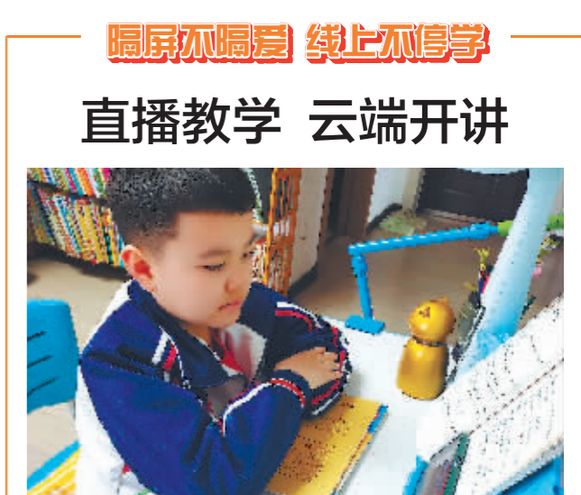
学生在家上网课。

本报讯(记者 叶勇)“开始……停……”随着音箱中传出的口令声,孩子们在老师的带领下,欢快地玩着各种游戏。这是小燕子幼儿园在暂停线下课后推出的线上活动,给居家孩子带来很多欢乐。 从14日起,根据防疫相关要求,幼儿园暂停线下开放,两个园区的十几个班200多名孩子全部居家。为了丰富孩子的居家生活,幼儿园制定了疫情特殊时期的《家园共育活动计划》。每天由各班老师定点线上带领孩子进行家庭居家指导活动,这其中既有老师带领孩子做游戏,也有家长参与的亲子活动;每天20时至21时,由园长和老师给家长举办“小燕子读书分享活动”,分享育儿方面的经验与知识,帮助家长解决育儿困惑。