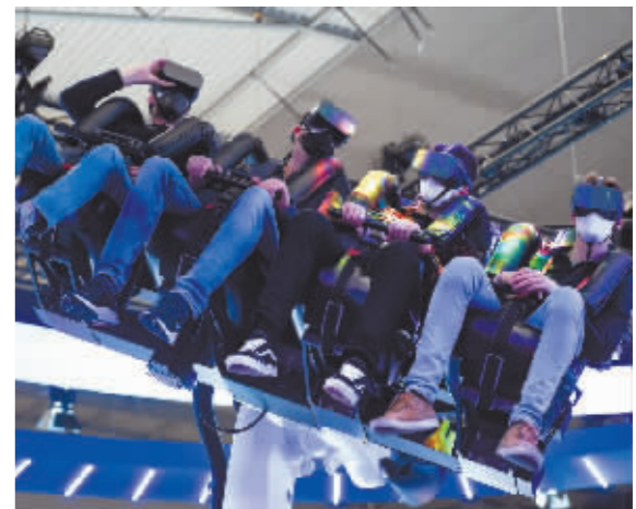
人们在世界移动通信大会上通过虚拟现实技术体验“4D元宇宙”。

中国移动董事长杨杰在主旨演讲中也描绘了这样的未来愿景:随着连接对象的拓展和基础设施的升级,“元宇宙”等新业态、新模式不断涌现,一个数字与现实世界交相辉映、更加广阔的人类发展新空间正加速形成。