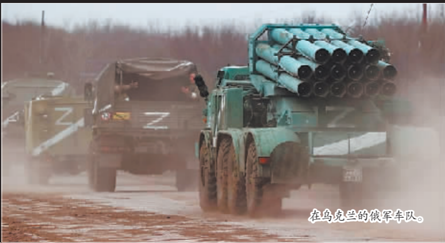
在乌克兰的俄军车队。

根据俄罗斯国防部发言人科纳申科夫2日晚发布的通报,在此次特别军事行动中,俄军已有498人阵亡,乌克兰军队阵亡人数超过2870人。