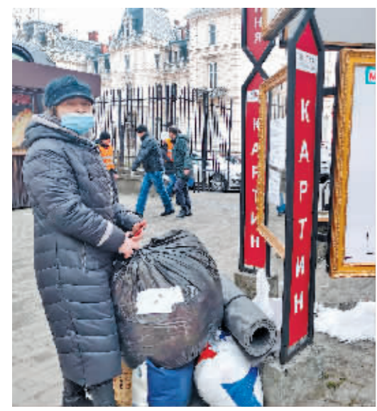
乌克兰民众在物资发放点领取生活用品。