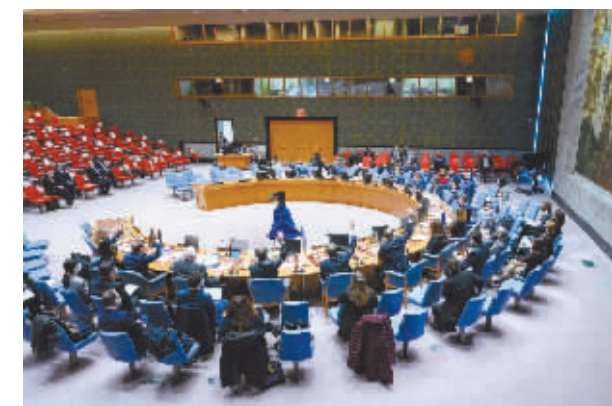
2月28日,在位于纽约的联合国总部,联合国安理会对决议进行表决。

据新华社电 联合国安理会2月28日通过第2624号决议,决定对也门胡塞武装实施武器禁运。这是安理会首次将胡塞武装作为实体列入武器禁运制裁范围。