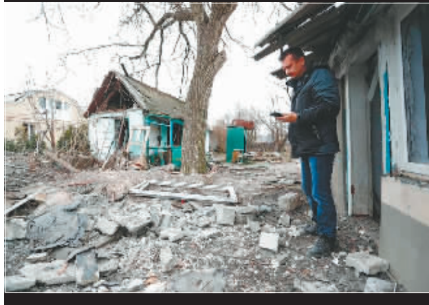
2月28日,在顿涅茨克,一名居民站在损坏的房屋前。