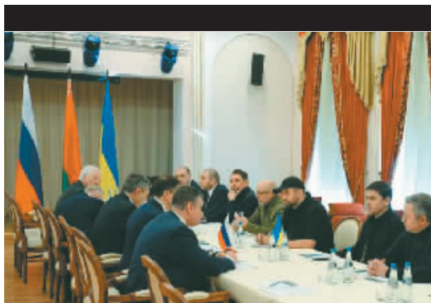
2月28日在白俄罗斯戈梅利州拍摄的谈判现场。

分析人士认为,此次谈判能够实现非常不易,谈判结束后双方的表态也相对克制与平和。同时也应看到,即便俄乌都有推动和平进程的意愿,但鉴于双方当前在许多重要问题上分歧巨大,危机化解之路将漫长而艰难。