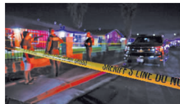
2月28日,警察在美国加利福尼亚州萨克拉门托发生枪击事件的教堂附近警戒。

当日,一名男子在美国加州萨克拉门托的一家教堂开枪,造成包括3名儿童在内的4人死亡,随后开枪自尽。这3名儿童均是开枪男子的孩子。