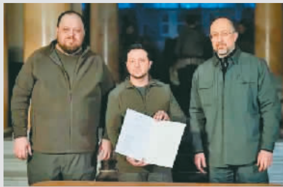
泽连斯基展示签署乌克兰申请加入欧盟的文件。