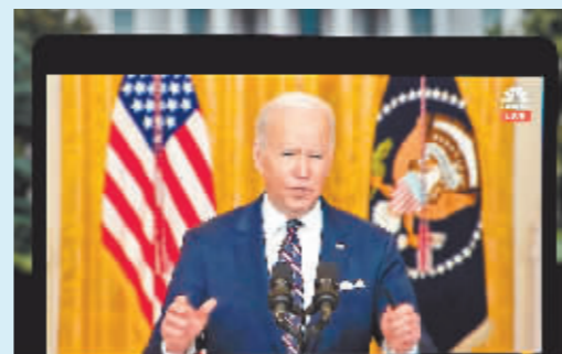
2月22日拍摄的视频画面显示,美国总统拜登在白宫就乌克兰局势发表讲话,宣布对俄罗斯实行经济制裁。