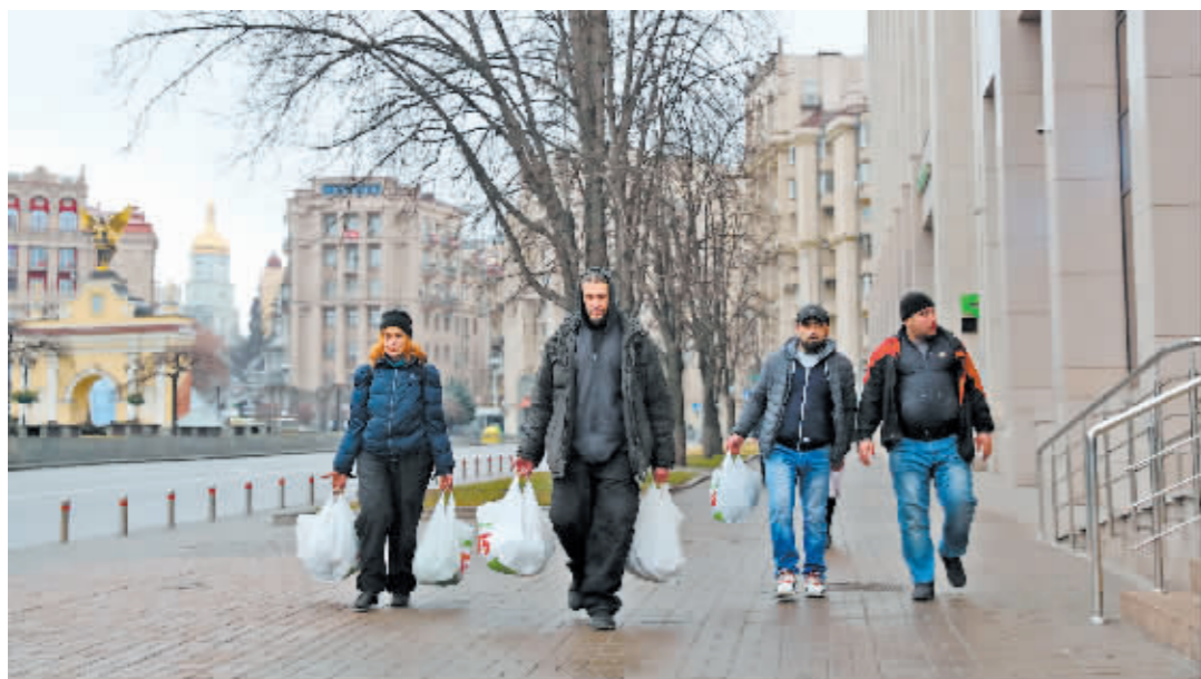
2月24日,在乌克兰首都基辅,当地居民拎着采购的物资走在街道上。当日,乌克兰最高拉达(议会)投票通过关于在乌克兰全境实施战时状态的总统令。

如有异议,请自本公告之日起十五个工作日内将异议书面材料共同送达哈尔滨市哈西新区房地产开发有限责任公司和哈尔滨市不动产登记交易服务中心道里一分中心。 异议书面材料送达地址: 哈尔滨市哈西新区房地产开发有限责任公司,哈西新区阳光街7号,联系电话:0451-51871905 哈尔滨市不动产登记交易服务中心道里一分中心,道里区经纬七道街3号,联系电话:0451-87630943。