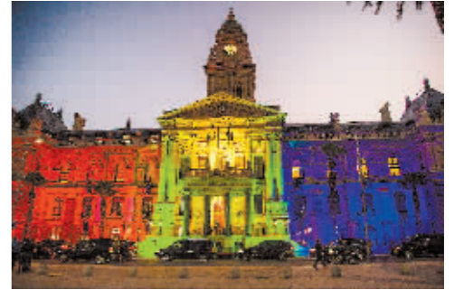
2月10日,南非开普敦市政厅点亮南非国旗色彩。

新华社开普敦2月23日电 南非财政部部长埃诺赫·戈东瓜纳23日在立法首都开普敦表示,南非财政状况前景有所改善,但仍面临显著风险。