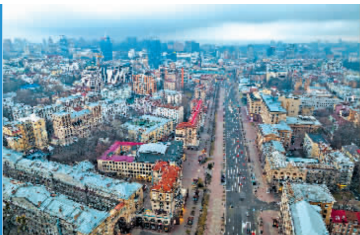
这是2月24日拍摄的乌克兰基辅的街景。