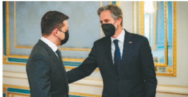
1月19日,乌克兰总统泽连斯基(左)在基辅会见美国国务卿布林肯。

“这是入侵乌克兰的开端。”美国总统拜登22日对俄罗斯祭出新制裁措施,以回应俄总统普京签署关于承认“顿涅茨克人民共和国”和关于承认“卢甘斯克人民共和国”的总统令。