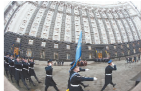
2月16日,乌克兰国民警卫队仪仗队行进至乌克兰政府办公大楼。14日,乌克兰总统泽连斯基签署命令,将2月16日定为乌克兰的团结日。