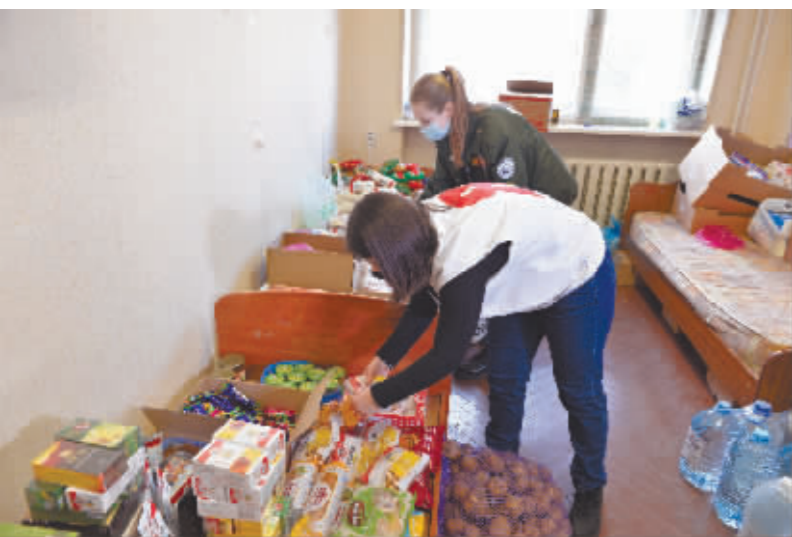
2月22日,在俄罗斯罗斯托夫州一处难民临时安置点,工作人员整理食品。

持续紧张的乌克兰危机日前再度升级,引发国际社会高度关注。当地情况怎么样?请看新华社记者从乌克兰和俄罗斯发回的报道——