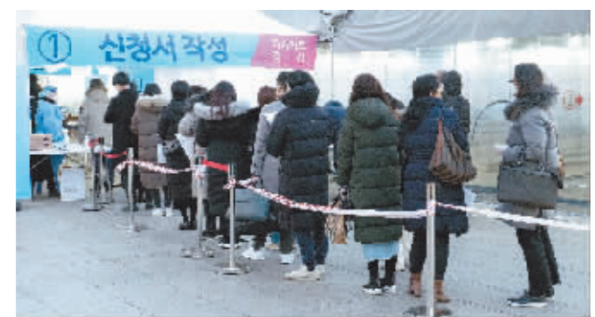
2月16日,人们在韩国首尔一处新冠病毒检测点排队等待检测。

新华社北京2月23日电 韩国卫生部门23日通报,由于变异新冠病毒奥密克戎毒株持续传播,韩国22日新增新冠确诊病例17.1万例,比一周前几乎翻倍,再次刷新日增病例数新高。