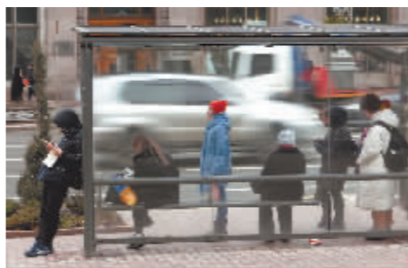
2月10日,市民在乌克兰基辅一处公交站等车。

他认为,一方面,无论俄罗斯还是西方,都没有能力和资源发动全面战争;另一方面,全球化已将欧亚大陆各国紧密联系在一起,没人愿意牺牲合作所带来的经济利益;因此在乌克兰爆发一场大规模战争的可能性不大,但在顿巴斯地区,军事上可能会出现复杂局面。他说,重要的是国际社会表示支持继续通过外交和平手段解决乌克兰东部问题。