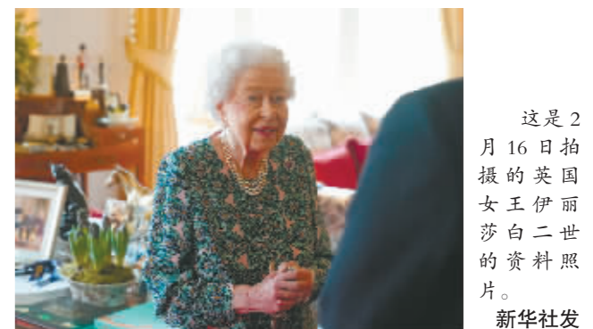
这是2月16日拍摄的英国女王伊丽莎白二世的资料照片。

新华社北京2月23日电 英国王室22日宣布,女王伊丽莎白二世取消原定当天举行的线上活动,因为她感染新冠病毒后,目前仍有“轻微类似感冒的症状”。