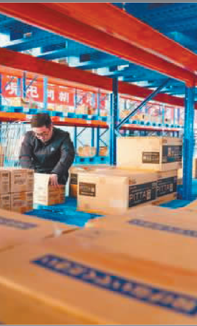
在唐京唐港区保税物流中心,跨境电商企业工作人员在整理货物。

日前,国务院批复同意在鄂尔多斯等27个城市和地区设立跨境电子商务综合试验区。这是该试验区近7年时间里的第6次扩围,范围已扩至全国132个城市和地区。从沿海到内陆,超百个城市和地区为何争先恐后加入试验区?