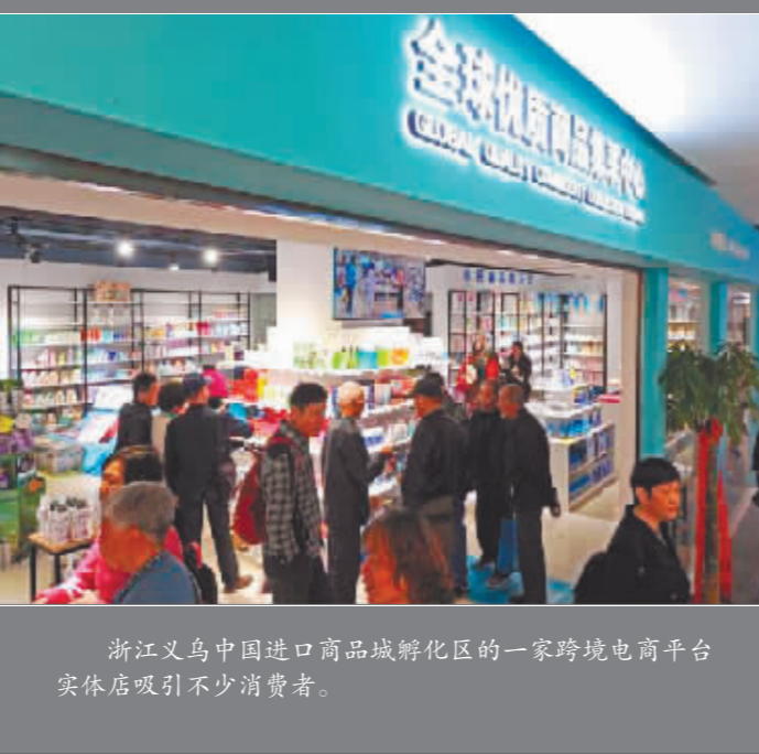
浙江义乌中国进口商品城孵化区的一家跨境电商平台实体店吸引不少消费者。