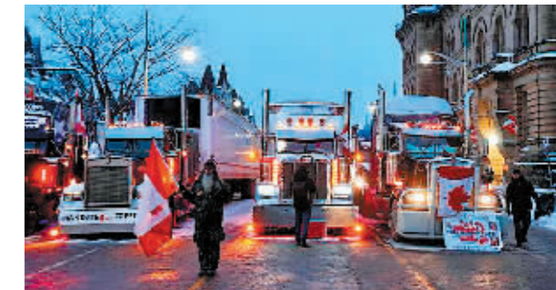
渥太华国会山附近,示威人员站在车队旁。

中新网消息 加拿大卡车司机对强制接种疫苗的抗议仍在持续,并已蔓延至新西兰、澳大利亚等国。受抗议示威影响,连接美加的重要通道——位于底特律市附近的“大使桥”被抗议者用卡车阻塞。另一处陆地通关要道,加拿大阿尔伯塔省边境的库茨地区,也被大量卡车堵塞,一度双向关闭。