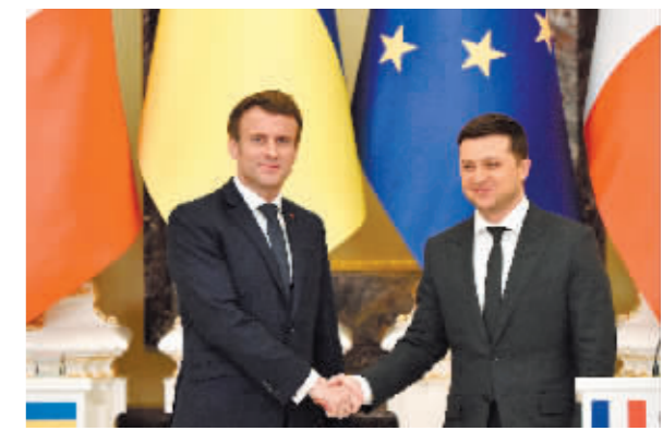
乌总统泽连斯基(右)与法国总统马克龙。

据新华社电 乌克兰总统泽连斯基8日在乌首都基辅会见法国总统马克龙,双方就加强双边合作和“诺曼底模式”会谈前景等问题进行讨论。