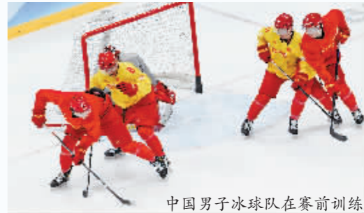
中国男子冰球队在赛前训练。