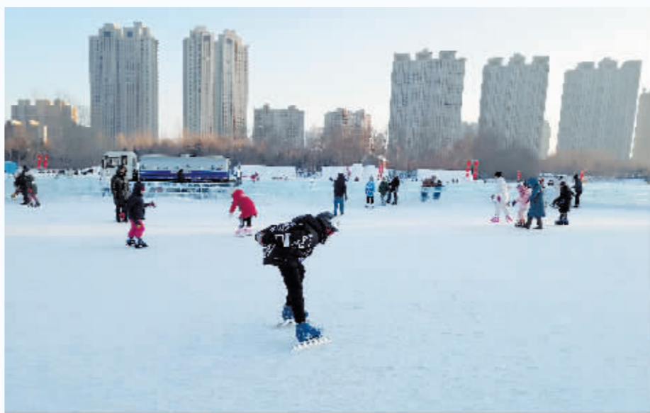
市民畅玩群力体育公园公益冰场。

如果,您也想在冰上驰骋,那就收藏好这份哈尔滨(主城区)公益冰场清单,一起去冰上撒欢儿吧。