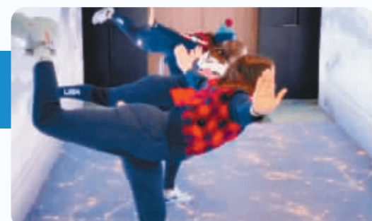
外国运动员学习太极拳。