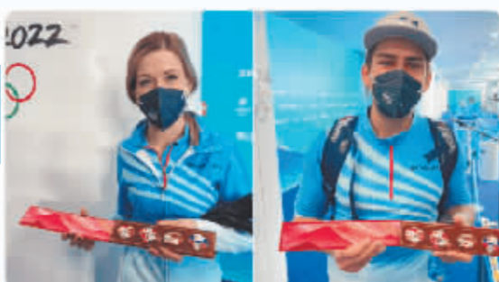
美国选手社交媒体账号截图。