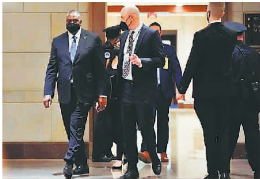
美国国防部长奥斯汀(左一)准备在国会出席一场听证会。美国国防部近日宣布将向欧洲增派部队，以应对俄乌边境地区紧张局势。

美国官员持续以私下吹风或公开讲话方式给俄乌边境局势“浇油”，称俄罗斯“随时”可能进攻乌克兰，规模可能大至“全面入侵”。