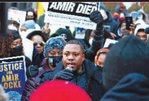
人们参加抗议集会。