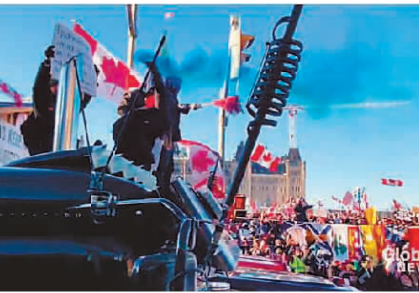
示威者打着“自由车队”的旗号开进渥太华抗议，并要求政府取消所有防疫管控措施。

加拿大首都渥太华6日因抗议示威活动而进入紧急状态。一些美国政客为这场发生在邻国的示威活动摇旗呐喊。