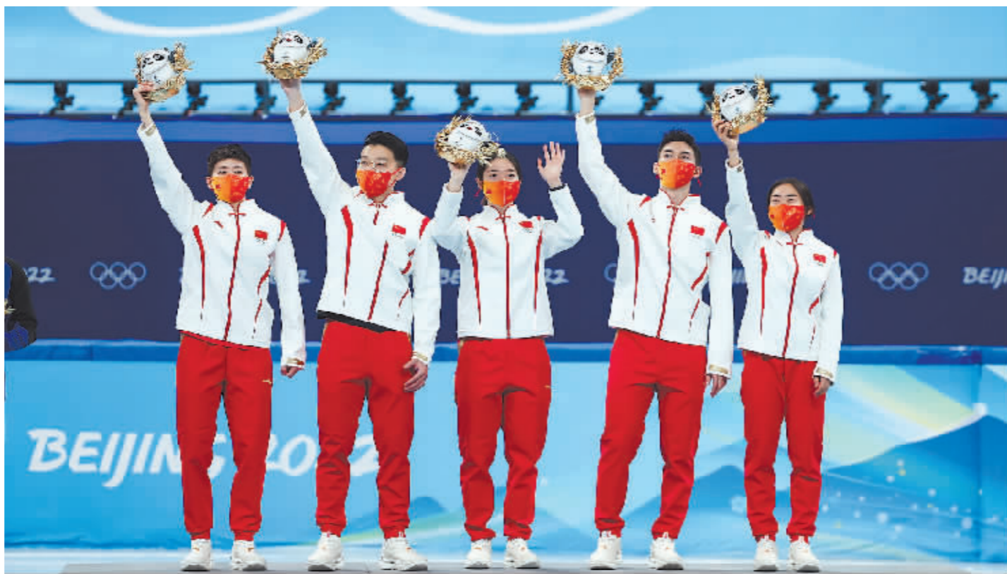
右图:中国队选手在颁奖仪式上。新华社记者 曹灿摄

中国短道速滑队还在当日的女子500米和男子1000米预赛中表现出色,6名选手出战全部晋级。