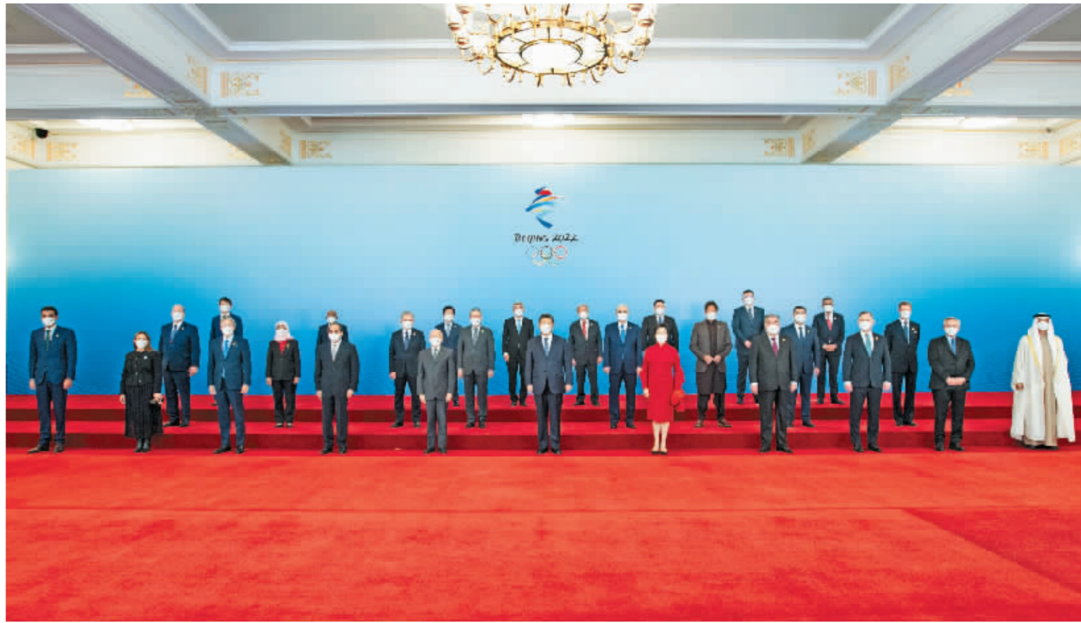
2月5日中午,国家主席习近平和夫人彭丽媛在北京人民大会堂金色大厅举行宴会,欢迎出席北京2022年冬奥会开幕式的国际贵宾。这是习近平和彭丽媛同国际贵宾一起合影留念。新华社记者 谢环驰摄

新华社北京2月5日电 国家主席习近平和夫人彭丽媛2月5日中午在北京人民大会堂金色大厅举行宴会,欢迎出席北京2022年冬奥会开幕式的国际贵宾。