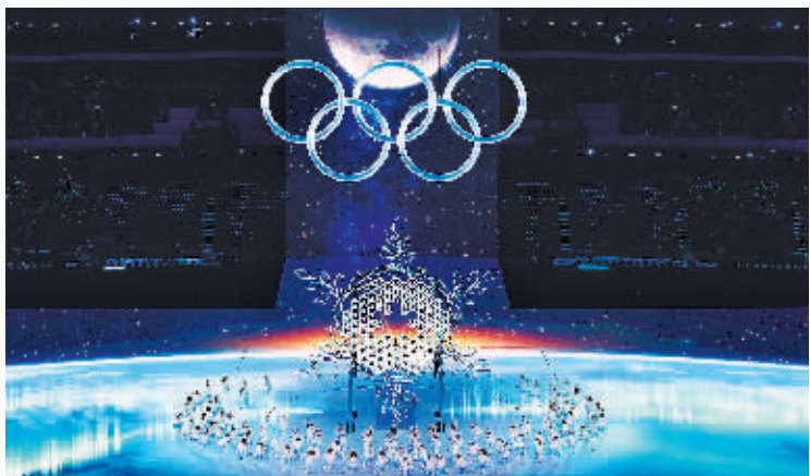
开幕式上的“构建一朵雪花”环节。