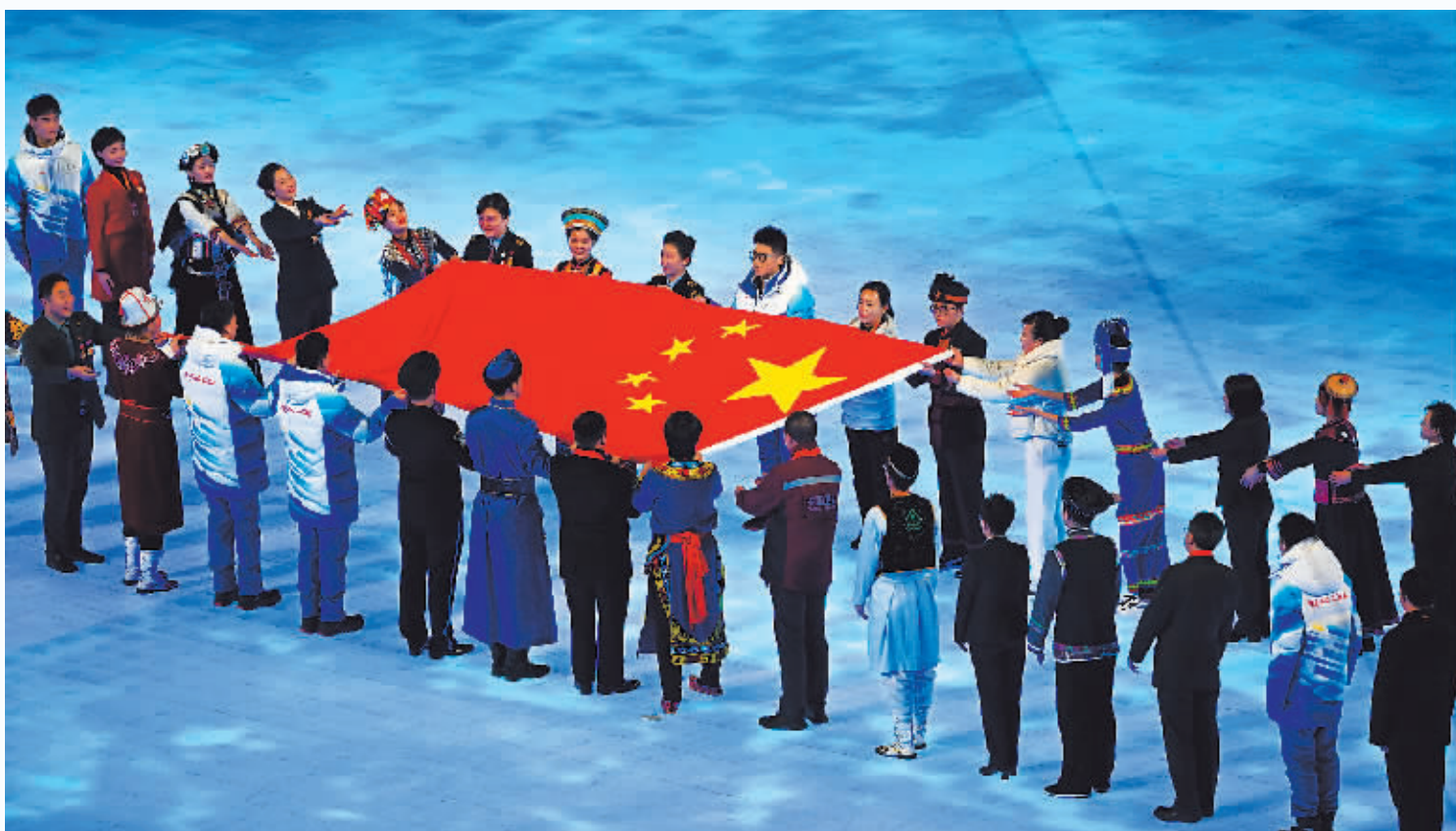
中华人民共和国国旗入场。