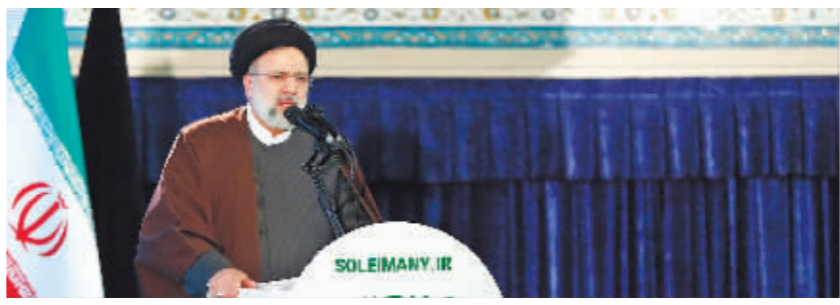
1月3日，伊朗总统莱希在苏莱曼尼纪念大会上讲话。

关于恢复履行伊核问题全面协议的维也纳谈判已经到了关键时刻。尽管参与谈判的各方不断传来乐观消息，但是迟迟没能宣布谈判完成，说明仍然存在一些问题。美国和伊朗如果能够直接会谈，将有利于解决双方分歧并推动维也纳谈判进程，对双边关系的发展也将带来影响。