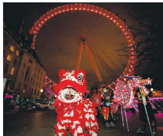
1月28日，在英国伦敦，演员在亮起“中国红”的“伦敦眼”前表演舞狮。28日晚，英国伦敦地标建筑、巨型摩天轮“伦敦眼”亮起红色灯光，迎接中国农历新年的到来。