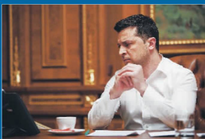
1月27日，乌克兰总统泽连斯基在基辅与美国总统拜登通电话，讨论乌克兰局势。