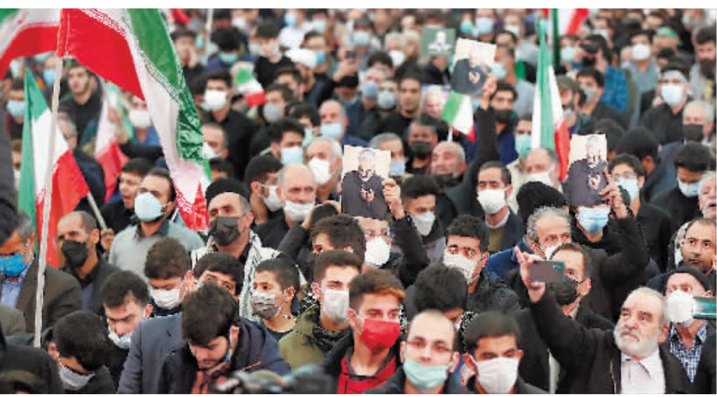
1月3日，人们在伊朗德黑兰举行纪念活动，悼念两年前遭美军空袭身亡的高级将领苏莱曼尼。

美国国务院发言人普赖斯日前表示，美国已准备好与伊朗就两国重返伊核协议等问题开展“直接对话”。伊朗外长阿卜杜拉希扬也表示可在一定的条件下与美国直接会谈。