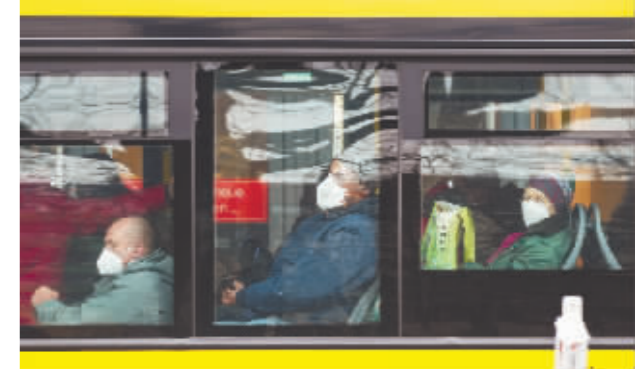
1月19日在德国首都柏林拍摄的一辆公交车上佩戴口罩的乘客。

新华社北京1月27日电 德国疾控机构罗伯特·科赫研究所27日发布的疫情数据显示,德国过去24小时新增新冠确诊病例20.3万例,创疫情暴发以来新高。