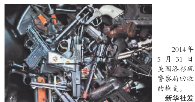
2014年5月31日美国洛杉矶警察局回收的枪支。

新华社北京1月27日电 美国加利福尼亚州洛杉矶地区频发货运列车盗窃案,大量快递件丢失。更糟心的是,洛杉矶警方日前透露,失窃物品中包括数十支枪。