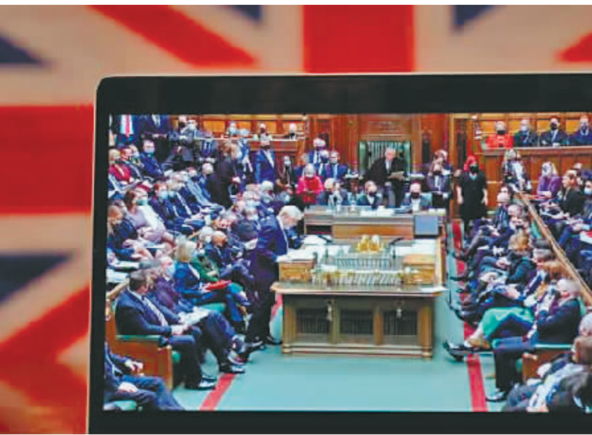
1月12日在英国伦敦拍摄的约翰逊在英国议会下院接受质询的直播画面。

新华社北京1月27日电 英国首相鲍里斯·约翰逊26日在议会回答质询时态度坚决,说自己不会辞职,并将按照先前承诺,公开政府就他所涉派对丑闻的内部调查报告全文。只是他所说的这份调查报告,未能如外界预测那样于当天交到他手上。