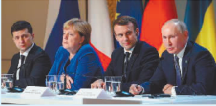
2015年2月11日,乌克兰总统泽连斯基(左一)、俄罗斯总统普京(右一)在“诺曼底模式”峰会上实现首次面对面交流。(资料片)