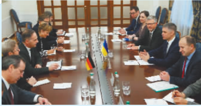
1月26日晚,来自法国、德国、俄罗斯和乌克兰的四方代表在巴黎举行“诺曼底模式”会谈。

“诺曼底模式”四方会谈26日晚在法国巴黎举行,来自法国、德国、俄罗斯和乌克兰的四方代表就缓和乌克兰危机等问题展开磋商。四方在会谈后表示,各方应无条件遵守停火协议,并加快推进明斯克协议的实施。