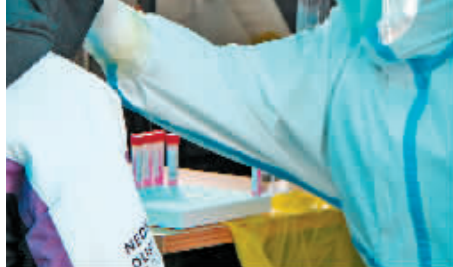
1月25日,北京市丰台区开展第二轮全员核酸检测。

面对奥密克戎,防输入仍是重中之重。过去一年多来,我国部分地区曾先后报道过新冠病毒在低温下长时间存活并经冷链传播的案例。对此,有关部门多次明确要坚持预防为主,人、物、环