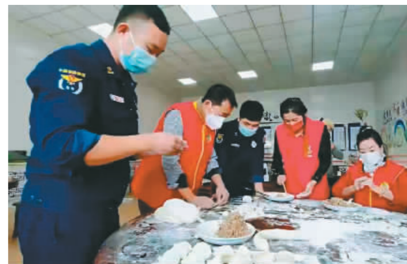
志愿者和消防员一起包饺子。

“这些年轻的消防员在家里是孩子,但为保一方平安他们节日期间无法与家人团聚。今天,我们用爱心、用真情包20000个爱心饺子,想让他们