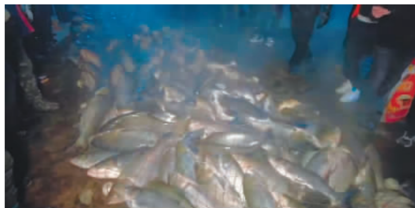
冬捕打上来的胖头鱼。

当众人把所有的鱼都收进鱼筐,夕阳已现。“鱼把头”一声“抬网”,渔民们二话不说,扛起渔网收工回家。坚