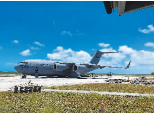
1月20日，澳大利亚空军一架飞机停在汤加首都努库阿洛法的富阿阿图机场。