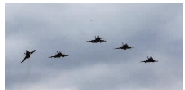
首批6架法国“阵风”战机19日抵达希腊首都雅典以北的一个空军基地，正式交付希腊。据报道，希腊是欧盟国家中首个购买法国“阵风”战机的国家。

图为1月19日，法国“阵风”战机飞翔在希腊首都雅典以北的塔纳格拉空军基地上空。新华社发