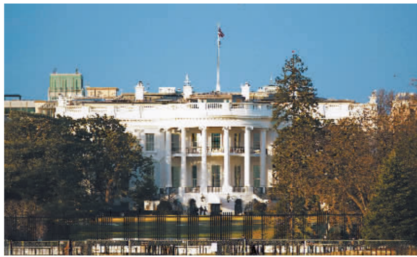
图为1月19日在美国首都华盛顿拍摄的白宫。

在“团结美国”方面，拜登也缺乏建树。一年来，美国两党更加对立，国会立法僵局更难破冰，社会分裂和民众对政府及媒体的不信任情绪加深。围绕去年1月6日国会山骚乱事件，国会民主党人大作文章，成立调查委员会传唤大量证人，但民调显示，多数选民认为国会相关调查具有一面倒的党派政治色彩。在拜登执政一周年之际，认可拜登执政合法性的选民仅占54%，为美国选举史所罕见，说明国会众议院民主党人主导的国会山骚乱调查不传唤多少前特