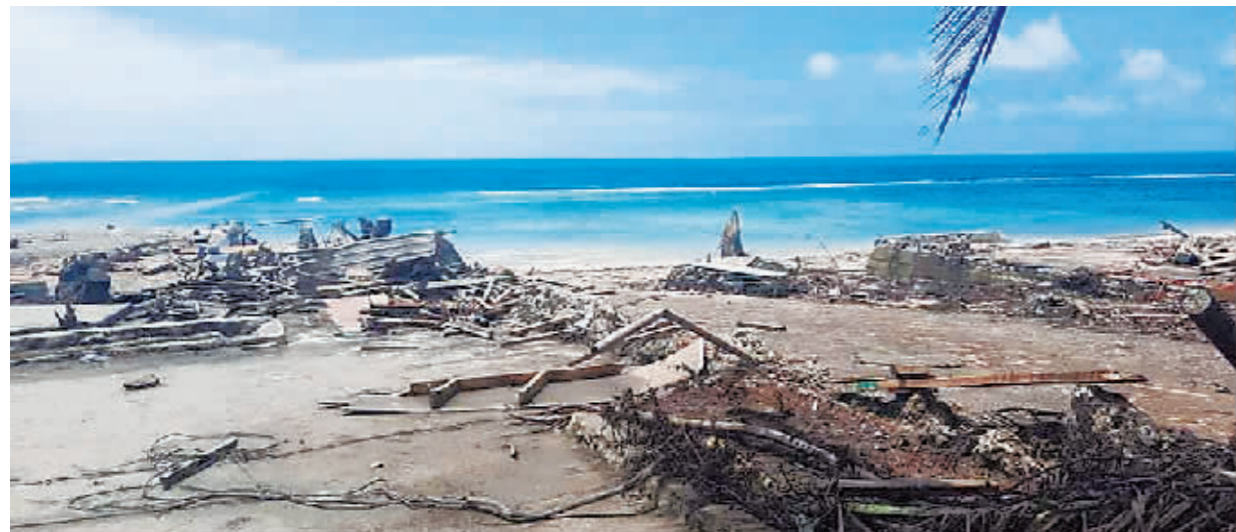
1月18日在汤加首都努库阿洛法拍摄的受灾区域。

汤加火山1月15日大规模爆发，引发海啸、火山灰等灾害，是汤加历史上最严重的自然灾害。记者20日从外交部了解到，中方已向汤加提供10万美元紧急人道主义现汇援助，并交付了一批价值28万元人民币的饮用水、食品等应急物资。