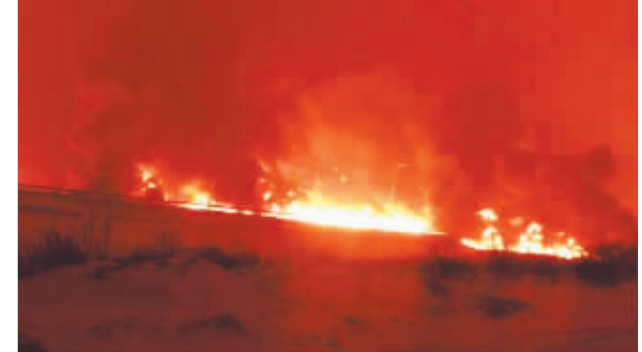
伊拉克石油部19日发表声明说，因爆炸中断的连接伊拉克北部基尔库克和土耳其杰伊汉港的输油管道已恢复运作。这张视频截图显示的是1月18日在土耳其东南部卡赫拉曼马拉什省帕尔扎克镇拍摄的输油管道爆炸现场。