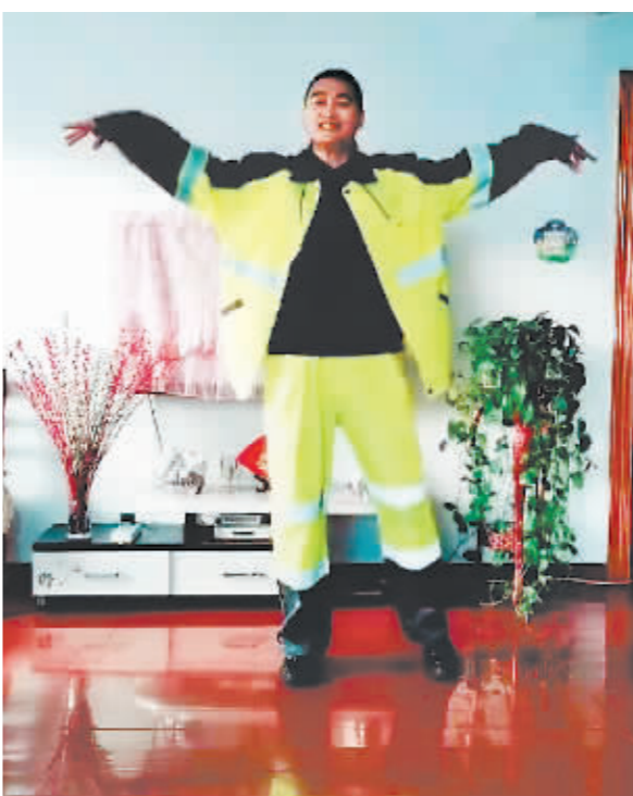
穿上新发的工作服,跳一段,上班去!