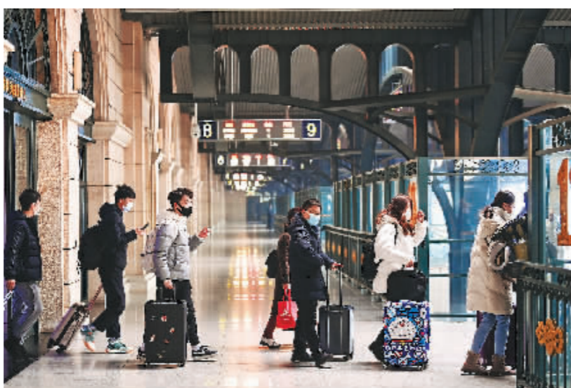
旅客有序进站乘车。

本报讯(记者 节永志)1月17日,为期40天的2022年春运正式开幕。记者从中国铁路哈尔滨局集团有限公司获悉,受疫情影响,今年春运铁路旅客出行存在较大的不确定性。但从目前车票预售情况看,今年铁路春运学生流、务工流、探亲流等基本出行需求仍将保持一定规模,预计哈铁将发送旅客635万人次,同比增长超过1倍。