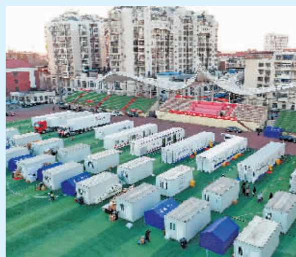
位于天津市滨海新区塘沽体育场内的方舱实验室。

继1月12日天津市疫情防控指挥部发布4号通告,强化天津市新冠肺炎疫情风险区管控措施之后,13日,天津市疫情防控指挥部再发布5号通告,升级天津市新冠肺炎疫情风险区管控措施,最大限度减少涉疫区域人员流动,降低疫情传播扩散风险。通告说,天津市疫情防控指挥部和涉疫地区指挥部将不断加大群众生活物资调配保障力度,统一安排车辆进出涉疫地区,严禁风险管控区域外人员自行前往封控区、管控区和防范区运送物资。居家隔离和居家医学观察人员要严格遵守疫情防控规定,切实履行个人义务,不串门、不聚会、不扎堆,劝导亲属朋友等勿前往所在风险区域运送物资,减少与风险区域人员接触。