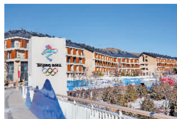
北京冬奥会张家口冬奥村(冬残奥村)。

据新华社1月13日电 记者13日从北京冬奥会张家口冬奥村(冬残奥村)场馆运行团队了解到,根据场馆运行实际需求,即日起张家口冬奥村启动闭环管理,进入赛时状态。