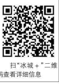
扫“冰城+”二维码查看详细信息

全市各市场主体应进一步强化疫情防控主体责任意识,自觉履行社会责任,严格执行各项防疫措施,共同筑牢疫情防控屏障。